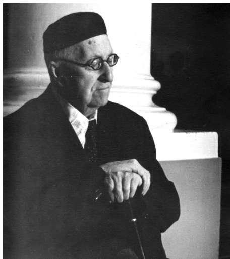
А. Ф. Лосев в последние годы жизни

между знанием и бытием в реалистическом символизме мыслится как некое онтологическое обстояние, как брак между субъектом и объектом, как порождение в браке прекраснейших созданий того и другого» 50 . Таким образом, Эрос, с одной стороны, это символ и миф, наиболее адекватный выразитель платоновского символизма, поскольку он ни бог, ни человек, «но богочеловек», синтез знания и чувственности, идеи и бытия, в котором сам акт познания мыслится как акт рождения 51 . С другой стороны, Эрос — «весь вождление, весь стремление, весь похоть» 52 и, на самом деле, это — просто «блудный бес, вкрадывающийся незаметно в душу, тонко и дальновидно соблазняющий ее лстивыми обещаниями, увертливый, обворожающий» 53 . Конечная же немощ платонизма заключается в том, что вместо рождения в красоте Платон на вершинах эротического восхождения приходит всего лишь к созерцанию 54 .