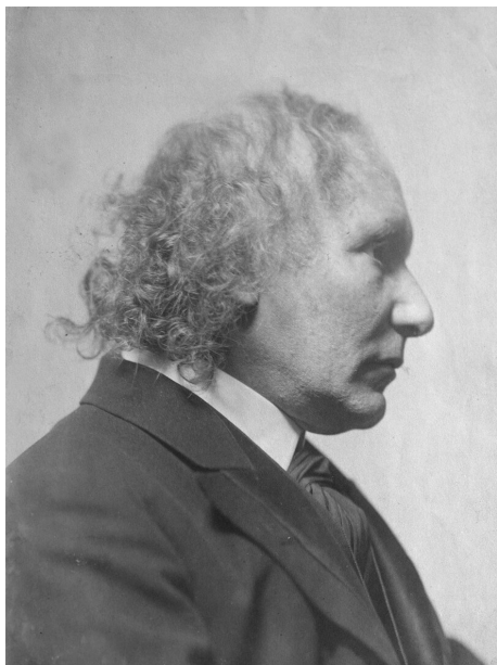
Вячеслав Иванович Иванов, 1900 г.

Начну с конца. Словами «трудна работа Господня», — предсмертными словами Соловьева, — Иванов начинает статью «Религиозное дело Владимира Соловьева» 19 . Сперва Иванов сопоставляет в ней Достоевского, Толстого и Соловьева. Из мистических экстазов Достоевского «переплеснула в поток поколений волна дионисийской силы» 20 . Проповедь Толстого была «сократическою универсальною проверкою всех утвержденных законом жизни и корыстью его основоположений» 21 . В противоположность им «Вл. Соловьев был художником внутренних форм христианского сознания. <...> Сама гармония воздвигнутого им миросозерцания пугала своею соразмерностью и законченностью; ближе нам, чем эта икона Афродиты Небесной, была хаотичность тех двух» 22 . Кроме того, размышляя о значении Соловьева, следует подчеркнуть, что «никто после Платона не сказал ничего столь глубокого и жизненного о любви и поле, увенчивая первую и восстанавливая человеческое достоинство и богочеловеческое назначение второго <...>. И для любви... — последняя