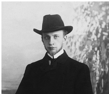
Иван Ильин, 1909 г.

Имя Ивана Ильина появилось на слуху в России довольно поздно, как и его труды в виде копий книг, брошюр и статей, которые стали известны в нашем мо-