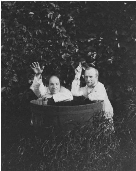
Иван Ильин и Николай Метнер, 1913 г.

вых расчетов, установленной в результате Бреттон-Вудской конференции (1–22 июля 1944 г.), которая сменила финансовую систему, основанную на «золотом стандарте», и создала, как оказалось, агрессивное доминирование американского доллара в мире. Более того, ни одно государство не в состоянии сейчас даже артикулировать правильную идею международных отношений. Например, «государства должны вести себя не как индивиды, а как личности: уважая и признавая „инаковость“ другого государства». Западные правоведы на такую мою идею ответили мне так: «Мы не готовы к такому уровню государственных отношений, и мы еще не исчерпали до конца идею государства как индивида», заботящегося только о своих интересах и не учитывающего интересы других стран.