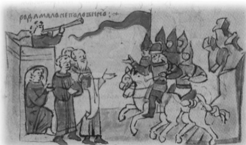
Ил. 16, миниатюра № 608. Возвращение Всеволода Юрьевича из военного похода

въезд князя в город и встреча его горожанами 47 . После службы в храме и занятия Рюриковичем княжеского двора центральным элементом была аккламация — провозглашение Рюриковича князем на княжеском дворе 48 . При анализе процедуры взаимодействия населения города и князя в период занятия последним княжеского стола в летописях можно найти устойчивые выражения со стороны горожан: «мы есте людие твои» и «ты еси нашъ князь» с упоминанием предков князя и главных храмов города 49 . Таким образом, в летописях процедура занятия княжеского стола представлена как определённая последовательность действий, важнейшей из которых было признание правителя населением, т.е. торжественный коммуникативный акт между горожанами и князем, закреплявший за последним право на княжение.