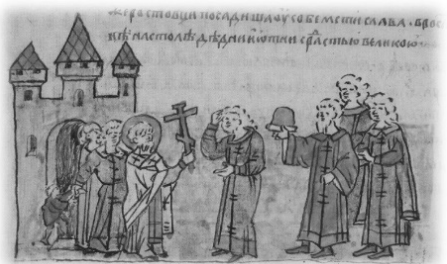
Ил. 19, миниатюра № 552. Встреча Мстислава и Ярополка Ростиславичей под стенами Владимира