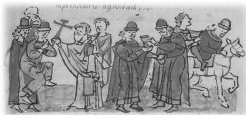
Ил. 24, миниатюра № 597. Крестное целование и примирение между князьями