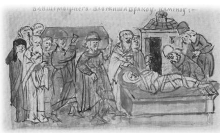
Ил. 27, миниатюра № 243. Перенесение мощей св. Бориса

При изучении изображений погребального обряда продуктивным представляется сравнение миниатюр РЛ с более ранними изобразительными источниками. Уникальные иллюстрации из «Сказания о Борисе и Глебе», связанные с княжеским погребальным обрядом, представлены на миниатюрах Сильвестровского сборника середины XIV в. — самого раннего из сохранившихся иллюстрированных списков «Сказания». В соответствии