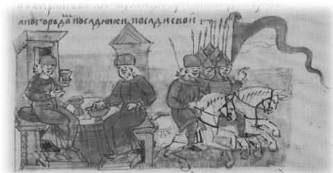
Ил. 22, миниатюра № 441. Заключение договора между киевским князем Изяславом Мстиславичем и Ростиславом Юрьевичем

ный между ними прислужник принимает чашу из руки Ярополка. Всеволод протягивает руки, чтобы чашу принять 62 . Помимо совместного распития, миниатюра № 403 отражает княжескую иерархию: престол Ярополка возвышается над престолом Всеволода, тем самым, изображение показывает более привилегированное (старшее) положение киевского князя. Совместное распитие как акт примирения показан на миниатюре № 441 (Ил. 22), где изображено заключение договора между киевским князем Изяславом Мстиславичем и Ростиславом Юрьевичем в 1148 г. 63 Два князя представлены сидящими на престолах друг напротив друга. Между ними небольшой стол, на котором стоят чаши. Изяслав левой рукой поднимает кубок 64 . Показательно изображено примирение двух неизвестных князей на миниатюре № 522 (Ил. 23). Князья вместе сидят на возвышенном пьедестале (престоле), пожимая друг другу руки. В левых руках они держат кубки. Внизу, с обеих сторон от князей, стоят приближённые, один из которых также