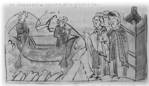
Ил. 30, миниатюра № 266. Доставка саркофага с телом Изяслава Ярославича к Городцу

Гибель Изяслава Ярославича произошла на Нежатиной Ниве недалеко от Чернигова (около 150 км от Киева), Святополк умирает в княжеской резиденции Вышгорода, расположенного в 1 км от пригородов современного Киева. Доставку усопших в древнерусскую столицу практичнее осуществить сухопутным путём, однако в летописях указывается именно ладья как средство транспортировки покойных. Данное обстоятельство может свидетельствовать о использовании ладьи как одного из элементов погребального обряда. Художник, в соответствии с текстом ПВЛ, изобразил ладью в случае захоронения только Изяслава Ярославича и проигнорировал доставку в ладье тела Святополка. Вероятно, художник, знакомый с географией Южной Руси, допускал