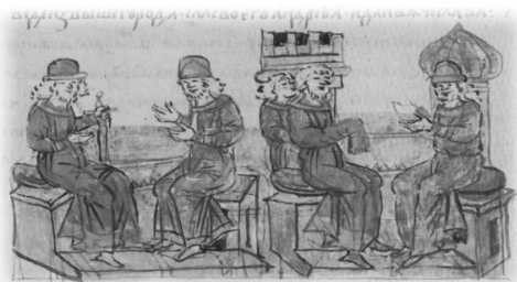
Ил. 4, миниатюра № 456. Вручение Юрием Долгоруким меча своему брату Вячеславу (слева)