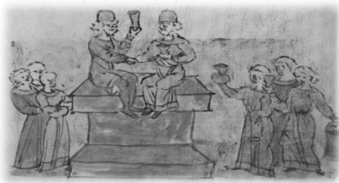
Ил. 23, миниатюра № 552. Примирение двух неизвестных князей

Миниатюры РЛ являются ценными свидетельствами по княжескому погребальному обряду. Погребения древнерусских князей в РЛ представлены на 18 изображениях. Во многом они соответствуют тексту летописи и иллюстрируют