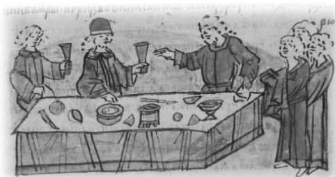
Ил. 14, миниатюра № 559. Приглашение Мстислава Ростиславича на ростовское княжение

Ярославом и отправлен в длительное заточение. Псковское княжение в результате событий 1036 г. было ликвидировано. Судислав был освобождён своими племянниками только в 1059 г., принёс присягу отказа от власти и принял монашеский постриг.