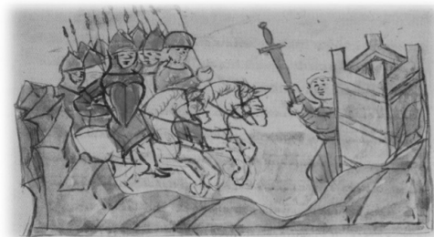
Ил. 10, миниатюра № 273. Взятие Мурوما волжскими булгарами

про меч как неизменный атрибут власти при описании подобных сюжетов не упоминается (см. примечания 30–39). Миниатюры, таким образом, дополняют летописный текст, определённо точно указывая на меч как инсигнию власти. Данный атрибут древнерусского князя, связанный с его властными полномочиями, для летописца и читателя летописей выглядел как само собой разумеющийся факт, про который не требовалось сообщать при каждом описываемом случае занятия князем стола. Миниатюрист же при изображении подобных сцен считал обязательным данную инсигнию изобразить.