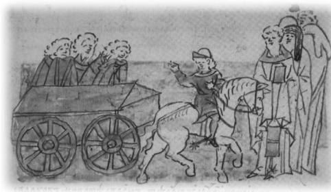
Ил. 31, миниатюра № 546. Перевоз тела Андрея Юрьевича из Боголюбово во Владимир