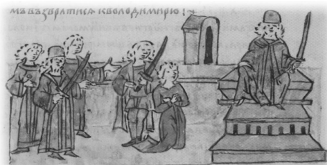
Ил. 9, миниатюра № 556. Посольство суздальцев к Михалку Юрьевичу

Обращает на себя внимание, что использование меча при наделении Рюриковичей княжением или при церемонии занятия князем стола представлено только на миниатюрах РЛ. В летописном тексте