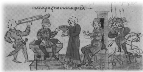
Ил. 21, миниатюра № 403. Примирение киевского князя Ярополка Владимировича и черниговского князя Всеволода Ольговича