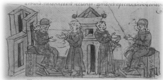
Ил. 7, миниатюра № 357. Вокняжение Всеволода Мстиславича в Новгороде (справа)