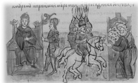
Ил. 15, миниатюра № 294. Встреча Изяслава Владимировича в Муроме (справа)