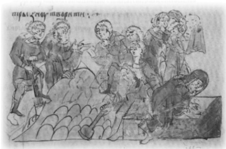
Ил. 25, миниатюра № 65. Погребение Игоря Рюриковича