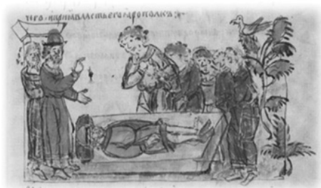
Ил. 26, миниатюра № 102. Оплакивание и погребение Олега Святославича

установленные обрядовые действия, совершавшиеся при княжеском погребении: присутствие при захоронении ближайших родственников усопшего князя (№ 65, 85, 102, 243, 490, 495, 558) 71 ; плачь (проявление скорби) об умершем (№ 65, 85, 102, 495, 544, 546, 558, 610) 72 ; перенесение тела князя к месту погребения (№ 158, 243, 266, 271, 546) 73 ; отпевание князя (№ 85, 192, 202, 271, 490, 495, 539, 544, 558, 610) 74 ; массовое стечение народа (№ 65, 85, 102, 163, 243, 266, 271, 490, 558) 75 ; похороны князя в специальном саркофаге; помещаемом в храме (№ 85, 158, 192, 243, 271, 353, 490, 495, 539, 544, 558, 610) 76 .