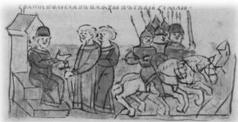
Ил. 5, миниатюра № 232. Повторное вокняжение Изяслава Ярославича в Киеве (слева)