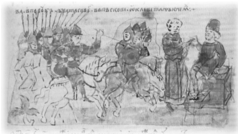
Ил. 11, миниатюра № 196. Лишение Судислава Владимировича псковского княжения (справа)

На миниатюрах № 357 (вокняжение в в Новгороде Всеволода Мстиславича) и 229 (обращение киевлян к Святославу Ярославичу) при занятии правителем княжеского стола меч князю вручает один человек. Также один человек (без меча), стоящий перед князем, изображён на миниатюрах № 226, 233, 383 40 . Меч как символ власти над городом показательно изображён на миниатюре № 273 (Ил. 10). На рисунке показан человек, который преподносит меч войску волжских булгар нападающих на Муром 41 .