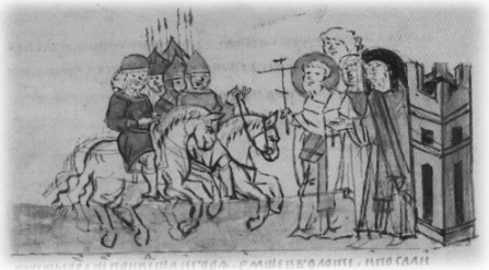
Ил. 18, миниатюра № 425. Встреча Изяслава Мстиславича при въезде в Киев

На миниатюре № 552 изображена процедура договора (ряда) между населением города и вступающим в него князем. Данный договор заключался посредством крестоцелования — договорной практики, осуществлявшейся между политическими акторами. Целование креста как публичный