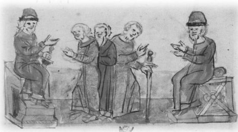
Ил. 6, миниатюра № 229. Обращение киевлян к Святославу Ярославичу с предложением княжить в Киеве (справа)

№ 456 (Ил. 4) 32 . Юрий и Вячеслав сидят на престолах на одном уровне напротив друг друга. В левой руке у Юрия невысоко поднятый меч, который он держит за рукоять, передавая Вячеславу. Изобразительная композиция данной сцены отличается от миниатюр № 157, 361, 407, однако общий семантический смысл изображенных действий на миниатюре № 456 аналогичен. После победы двух братьев над племянником Изяславом Мстиславичем в борьбе за Киев, Юрий, приняв по настоянию киевлян верховную власть над великокняжеским городом, посадил Вячеслава в соседнем Вышгороде, обозначив тем самым совместное правление двух князей Мономашичей. Подобного рода изображение представлено на миниатюре № 360, показывающее наделение Владимиром Мономахом своего сына Романа Владимировичем княжением 33 .