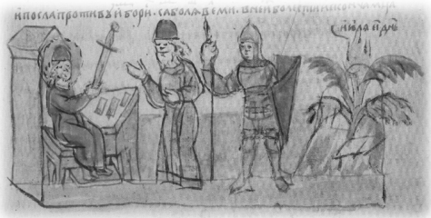
Ил. 1, миниатюра № 157. Вручение Владимиром Святославичем меча своему сыну Борису

согласно поздней летописной традиции, было размещено в Троицком соборе Пскова «при погребении князя в 1137 г.» 22 . Сам артефакт относится к типу вооружения XIV–XV вв. Тем не менее, есть основания предполагать существование более раннего меча XII в. по аналогии с «мечем св. Бориса» 23 . Гипотетически можно считать, что артефакт хранился в одном из храмов Владимира-на-Клязьме 24 .