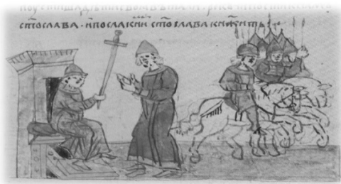
Ил. 3, миниатюра № 407. Вручение Всеволодом Ольговичем меча своему брату Святославу

о Борисе и Глебе: Факсимильное воспроизведение житийных повестей из Сильвестровского сборника (2-я половина XIV века). М., 1985. С. 27–28).