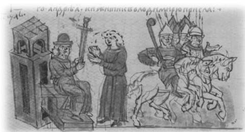
Ил. 2, миниатюра № 361. Вручение Владимиром Мономахом меча своему сыну Андрею

Сцена передачи меча как символа власти над Вышгородом Юрием Долгоруким своему старшему брату Вячеславу Владимировичу изображена на миниатюре