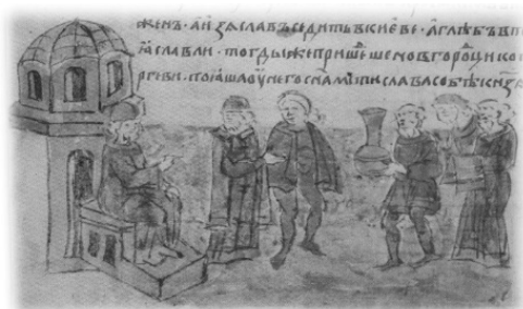
Ил. 12, миниатюра № 500. Посольство новгородцев к Юрию Долгорукому

Ряд сообщений древнерусских летописей содержит как первичное звено церемониальных событий торжественный