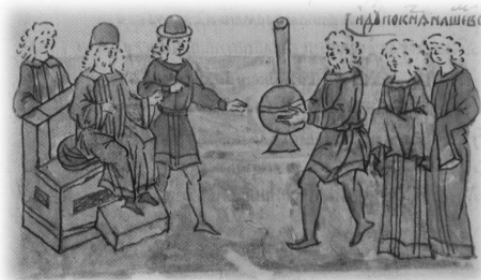
Ил. 13, миниатюра № 547. Посольство ростовцев и суздальцев к Глебу Ростиславичу