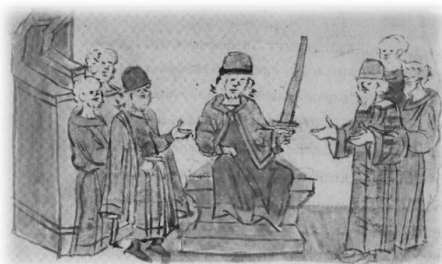
Ил. 8, миниатюра № 502. Вокняжение Юрия Долгорукого в Киеве

по старшинству среди Ярославичей 35 . На миниатюре № 357 (Ил. 7) изображена сцена вручения меча Всеволоду Мстиславичу перед началом его княжения в Новгороде 36 .