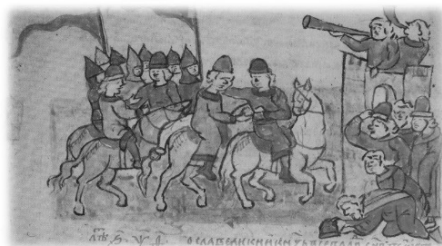
Ил. 17, миниатюра № 609. Встреча Святослава Всеволодовича в Новгороде

въезд князя в город и встреча его горожанами 47 . После службы в храме и занятия Рюриковичем княжеского двора центральным элементом была аккламация — провозглашение Рюриковича князем на княжеском дворе 48 . При анализе процедуры взаимодействия населения города и князя в период занятия последним княжеского стола в летописях можно найти устойчивые выражения со стороны горожан: «мы есте людие твои» и «ты еси нашъ князь» с упоминанием предков князя и главных храмов города 49 . Таким образом, в летописях процедура занятия княжеского стола представлена как определённая последовательность действий, важнейшей из которых было признание правителя населением, т.е. торжественный коммуникативный акт между горожанами и князем, закреплявший за последним право на княжение.