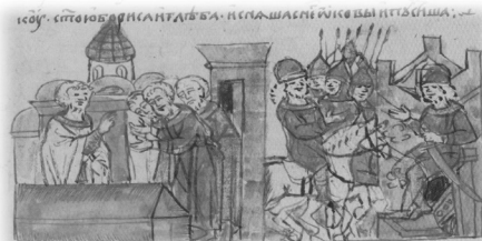
Ил. 28, миниатюра № 327. Рака с мощами Бориса и Глеба