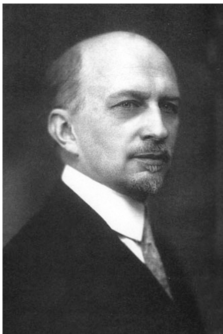
Иван Александрович Ильин (1883–1954)

Крупнейший русский философ XX в. Иван Александрович Ильин (1883–1954) внес значительный вклад в исследовательское истолкование много явлений русской художественной культуры — прежде всего как проницательный филолог, постигающий их сокровенные, сущностные смыслы. Им были прочитаны в разных странах и во многих городах публичные лекции, разработаны университетские курсы, опубликовано несколько книг и брошюр, ряд статей, осуществлены переводы на немецкий язык художественной прозы и поэзии 1 .