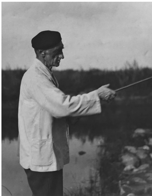
Иван Сергеевич Шмелев, 1935 г.

Для И. А. Ильина таким писателем, чье творчество позволило наиболее полно, отчетливо и глубоко определить и высказать собственные эстетические позиции и духовно-