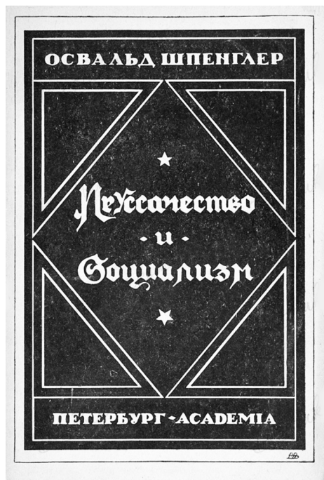
Российское издание 1922 г. книги Шпенглера «Пруссачество и социализм» (1919)

В работе, вышедшей годом позже второго тома «Заката Западного мира» и являющейся в некотором смысле его продолжением, Освальд Шпенглер писал: «В слове „пруссачество“ заключено все, чем мы, немцы, обладаем, не в области неопределенных идей, желаний, фантазий, а в смысле воли, задач, возможностей, определяющих судьбу нации» 23 . Причем «пруссачеством» обладают не все немцы — как и должно быть в любой нации. И ядром немецкой национальной идеи, с точки зрения Шпенглера, является социализм, под которым, в первую очередь, понимается готовность каждого жертвовать собой ради всех — «все за всех». Эта идея «служения во имя нации» определяет все особенности современной Германии и немецкой нации. Так, в отличие от Англии, классы в Германии возникают не на основе богатства (или контроля над средствами производства), а как ранги государственной службы. Именно поэтому Шпенглер так резко критиковал Маркса — его понимание социализма он воспринимал как угрозу для «пруссачества». Второй причиной неприятия Маркса и марксизма стала продвигаемая им идея интернационализма, который является причиной увядания культуры, превращения «города» в «мировую столицу».