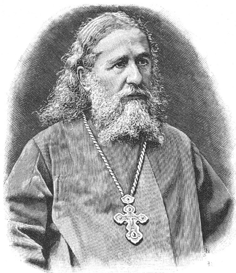
Протоиерей Иоанн Яхонтов

чий воодушевленный импровизатор, последний и поныне (в 1890 г. — Д. К.) славится, особенно делами благотворения и любви христианской» 1 .