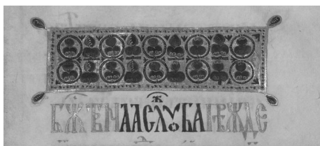
Илл. 3. Полихромное письмо в заглавии РНБ. Погод. 37 (Службник Симеона, серед. XIV в.). Л. 74.

XIV в. и великолепно украшена с художественной точки зрения. Ее эстетическое богатство проявилось не только в орнаментальном убранстве, но и в оформлении вязи. Большинство заголовков написаны золотом. Однако в рубрике «Божественаа служба преждесвященнаа» (л. 74) использован также синий цвет. Им написаны последние две буквы слова «Божественаа» и чтение «служба» (илл. 3). Сочетание синего пигмента и золота хорошо согласуется с декором манускрипта, выполнен-