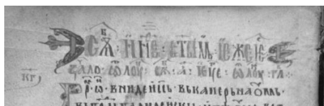
Илл. 2. Образец полихромного письма в заглавии рукописи БАН. собр. Н.К. Никольского №2. Л. 56 об. (Евангелие апракос, кон. XIII в.).

Наиболее ранней рукописью, в которой разными цветами выполнены сами литеры заголовков, является Евангелие Апракос БАН. Никольск. 2 (конец XIII — начало XIV вв.) 10 . С одной стороны, его переписчик использовал уже известный нам метод раскраски промежутков между буквами. На л. 56 об., 79, 132, 134, 135 об., 136, 136 об., 141, 141 об., 143 расстояние, разделяющее графемы, расцвечено желтым пигментом. На л. 37 об. и 101 помимо желтого применяется также зеленый краситель. В то же время на л. 37 об., 56 об., 79 в заглавиях чередуются киноварные и пурпурные буквы (илл. 2). На л. 143 основная часть названия чтения написана красным цветом, однако в заключительной его части киноварные литеры начинают чередоваться с черными. На л. 148 красные буквы перемежаются с графемами, выполненными чернилами. Таким образом, перед нами наиболее ранний случай применения полихромного письма для оформления заглавий. Используя различные цвета для написания литер вязи, книжник, работавший над рукописью БАН. Никольск. 2, сделал манускрипт стилистически более выразительным и разнообразным. При этом следует отметить, что, как и в предыдущих рукописях, цветовая гамма рубрик и декора совпадают. Таким образом, сохраняется цветовое единство манускрипта.