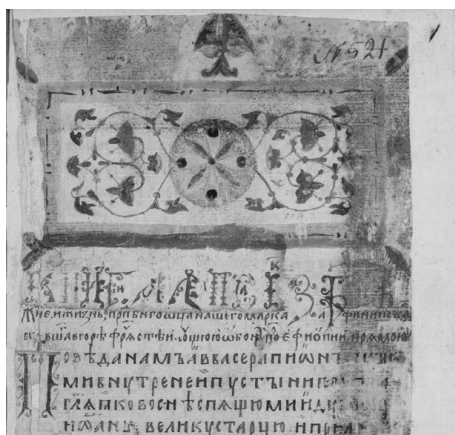
Илл. 5. Заглавие из рукописи БАН. Сол. 7 (Лавсаик Зосимы Соловецкого, нач. XV в.). Л. 1