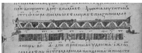
Илл. 1. Образец оформления заглавия в рукописи БАН. Срезн. II. 59 (Добрианова минея, XIII в.). Л. 6

на этом же листе присутствует маргинальное украшение в виде орнаментальной листвы, которое также не имеет расцветки. Таким образом, путем раскраски расстояний между буквами в Добриановой минее было сформировано стилистическое единство декоративных заглавий и орнаментики рукописи. Другой образец подобного подхода к цветовому оформлению заглавий представлен в рукописи БАН. Сырку 8 (ст. шифр: 4.5.16), датируемой XIII в. 8 Здесь