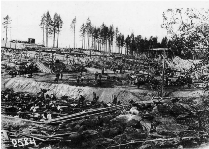
Строительство Беломорско-Балтийского канала заключенными Белбалтлага, где отбывал наказание А. Ф. Лосев, 1933 г.

смысла этого социально-экономического института. Он писал так: «Прикрепление производителя к земле есть только логически-необходимый результат понимания человеческой личности именно как реальной человеческой личности. Ее нечего освободить, так как, во-первых, она и без того свободна (ибо подлинная свобода личности есть свобода не материальная, а духовная), а во-вторых, ее и невозможно освободить (ибо человеческими усилиями не дано преодолеть первобытный грех...). Поэтому настоящее средневековое, нелиберальное христианство никогда и не обещало материального освобождения, считая последнее вредной, хотя и наивной, мечтой. Оно полагало, что оно освободило человека духовно, избавивши его от „языческой мерзости“, и в этом отношении оно строго отличало духовно свободного крепостного от античного раба, который был не человеком, но вещью и был рабом „по природе“. Церковь вполне согласно с своим учением могла покупать и продавать крепостных, понимая, что она торгует не самим человеком, но лишь его прикреплением к земле» 20 .