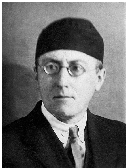
Алексей Федорович Лосев в 1929 г., в год принятия тайного монашеского пострига

Эсхатологическая историософия А. Ф. Лосева (монаха Андроника) — уникальный феномен выражения аутентичного православного понимания истории в формах восточной философской мысли. Историософия А. Ф. Лосева в развернутой форме была изложена в «Дополнениях к „Диалектике мифа“», а затем дополнена в «Предисловии» к «Истории эстетических учений» (1930-е). Для понимания и оценки периодов мировой истории А. Ф. Лосевым применяется строго христианский критерий — степень жизни человека во Христе и уровень развития личности в христианском понимании этого слова — как бессмертной души и образа Божия в человеке. Другие критерии — такие, как развитие материальной цивилизации и светской культуры, политические «свободы» и проч. — безразличны и на оценку исторических эпох не влияют. Этим определяется шокирующая современного человека характеристика А. Ф. Лосевым основных исторических эпох. Вершиной мировой истории по Лосеву является Средневековье, после которого наступает неуклонная духовная деградация человечества, ведущая к приходу Антихриста и Апокалипсису 1 .