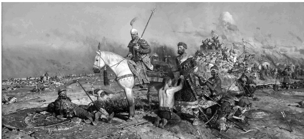
Калка. Худ. П. В. Рыженко, 1996 г.