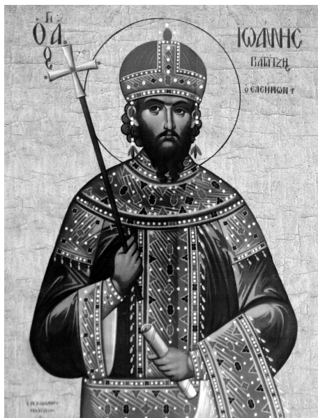
Святой Иоанн Ватац Милостивый — никейский император (1221–1254) Иоанн III Дука Ватац