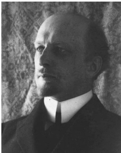
Иван Александрович Ильин. Прага, 1925 г.

межличностных отношений. Но когда дело возвышается до проблематики национальной самообороны, до защиты близких своих, тут никаких компромиссов нет, и не надо ссылаться на кенозис. С христианской точки зрения, кто так рассуждает — хуже язычников: «Если же кто о своих и особенно о домашних не печется, тот отрекся от веры и хуже неверного» (1 Тим 5:8). Недаром в знаменитом видении Пелгусия святые «непротивленцы» Борис и Глеб являются небесными воителями за Русскую землю.