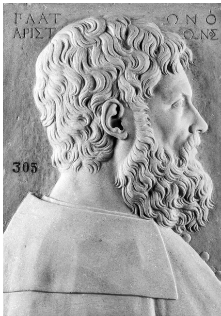
Платон. Национальный музей Прадо, Мадрид. Скульптор — предположительно, Винченцо Гранди, 1525–1550 гг.

По мнению русского философа-славянофила А. С. Хомякова, развивавшего идеи И. В. Киреевского, католицизм задается «логической рассудочностью», которая определяет перспективу становления всей западноевропейской культуры от Аристотеля через схоластику к гегельянству и характеризуется предельным господством рационализма, когда человеческое познание полностью отвлекается от бытия и торжество разума реализуется «в новом создании целого мира» 2 . В самом деле, начиная с XIII в. античный «Философ» становится на Западе своеобразным символом средневековых университетов и всей системы схоластической учености 3 . По сути, для того