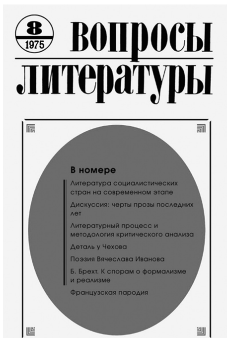
«Вопросы литературы», № 8 за 1975 г.

В 1975 г. в «Вопросах литературы» вышла статья С. С. Аверинцева «Поэзия Вячеслава Иванова», возвратившая российскому читателю полузабытого на Родине писателя и теоретика литературы. Та журнальная публикация оставила глубокий след и в судьбе ее автора. Недаром он еще не раз обращался к творчеству поэта, тихо завершившего свой век в Италии, и даже посвятил ему книгу «Скворешниц вольных граждан...», написанную в жанре интеллектуальной биографии.