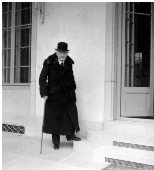
Вячеслав Иванов, 1934 г.

Такой самобытный мыслитель, как Аверинцев, не мог довольствоваться ролью «нотариуса», своим авторитетом заверяющего воспоминания Иванова и возводящего