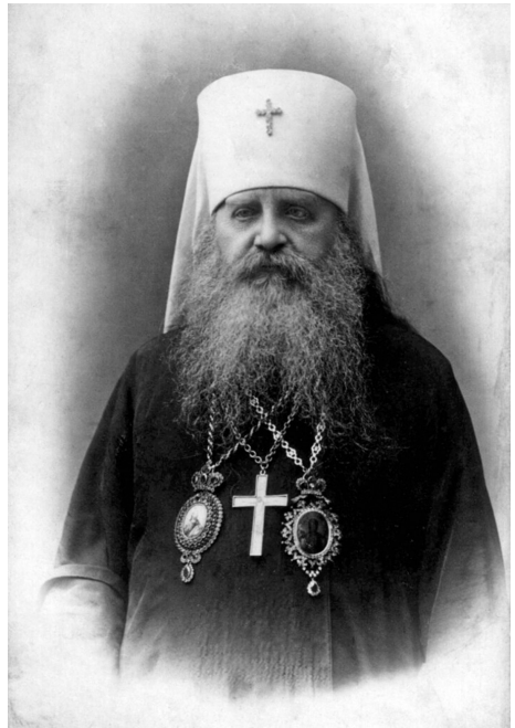
Высокопреосвященный Антоний, митрополит Киевский и Галицкий, 1920-е гг.

Как известно, РПЦЗ сыграла выдаю­щуюся роль в сохранении наследия рус­ской культуры и языка, а также памяти крупнейших деятелей отечественной куль­туры (А. С. Пушкина, Ф. М. Достоевско­го и др.), в несении «подвига русскости» в XX в. Как сказано выше, Достоевский был любимым писателем митр. Анто­ния — иерарх горячо рекомендовал читать его произведения и постоянно обращался к ним в своих проповедях и сочинени­ях. «Самый русский из наших писателей и самый православный среди русских» — так он называл Достоевского. Размышляя о судьбах Святой Руси, митр. Антоний неизменно ссы­лался на любимого автора. Написанный им в заключении во время Гражданской войны словарь к творени­ям Достоевского был издан в Болгарии в 1921 г., в год 100-летия со дня рождения писателя. Сам иерарх так говорил об этой работе: «Мой „Словарь к Достоевско­му“ — не столько для народа, сколько для интеллигенции, ибо она сделала рево­люцию, и хотя горько в ней кается, но главная задержка наша в когтях анархии зависит не от народа, а от той же интеллигенции» 18 . В данном словаре можно отме­тить, например, актуальную в наши дни главу «Европа и Россия по Достоевскому», в которой автор, опираясь на рассуждения классика, разъясняет ненависть Европы к России невежеством первой: «Россия — совершенно неведомая Европе страна, больше, чем Китай» 19 , и подчеркивает, что эти незнание и нежелание познавать русский мир происходят главным образом по причине неприязни европейцев 20 .