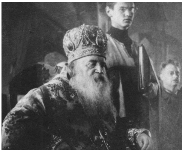
Митрополит Антоний во время богослужения, 1936 г.

(Максименко) во епископа Детройтского и иеромонаха Иоанна (Максимовича) во епископа Шанхайского 101 .