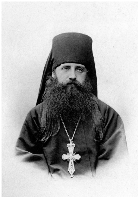
Митрополит Антоний (Храповицкий) в бытность архимандритом, 1891–1895 гг.

что юный Алексей Храповицкий стал прообразом главного героя последнего романа Федора Михайловича — Алеша Карамазова. Впоследствии митр. Антоний это отрицал, указывая на то, что писатель не знал его лично.