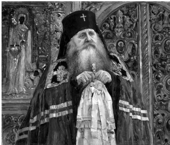
Архиепископ Антоний Волынский. Худ. М. В. Нестеров, 1917 г.

теперешнюю свободную Грецию с Цареградом под мирскою властью самодержца-грека и под духовною властью Вселенского греческого Патриарха» 14 . Владыка выступает здесь не только как славянофил, но еще более как грекофил: «Нам нужно греков, чтобы понять свое Православие? Да, непременно нужно! Православие многие из нас вмещают в своем сердце лучше греков, но вмещают его как молитву, как подвиги смирения и милосердия, как устройство благолепия церковного, а православного сознания, выраженного в ясных определениях, в противовес заблуждениям Запада, православной гражданственности, т.е. форм общественной и школьной жизни, согласованных с неповрежденным пониманием христианства, у нас нет в русском обществе и почти нет в русских академиях. Мы хорошие христиане, но мы не философы» 15 .