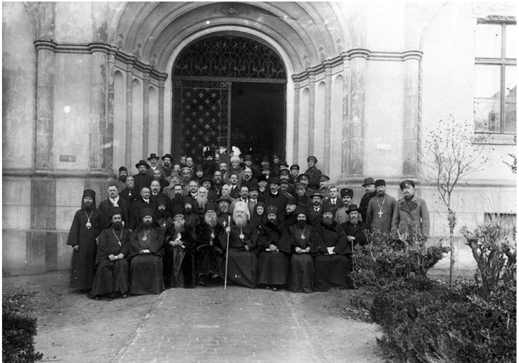
Участники Русского Заграничного Церковного Собрания (Первого Всезарубежного Собора) в Сремских Карловцах, 1921 г.

В 1929 — начале 1930-х гг. председатель Архиерейского Синода РПЦЗ наибольшее внимание уделял положению Русской Православной Церкви на территории СССР. Весной 1929 г. в Советской России началась новая волна жестоких антицерковных гонений; в ноябре того же года Красная Армия на несколько недель вторглась в приделы Китая в Трехречье, где проживали русские беженцы из Сибири, которые подверглись безжалостному уничтожению. На эти события митрополит Антоний отозвался пламенным обращением к народам всего мира, посланным главам значительной части правительств, православных Церквей, инославных и иноверческих религиозных организаций и редакциям важнейших газет 79 .