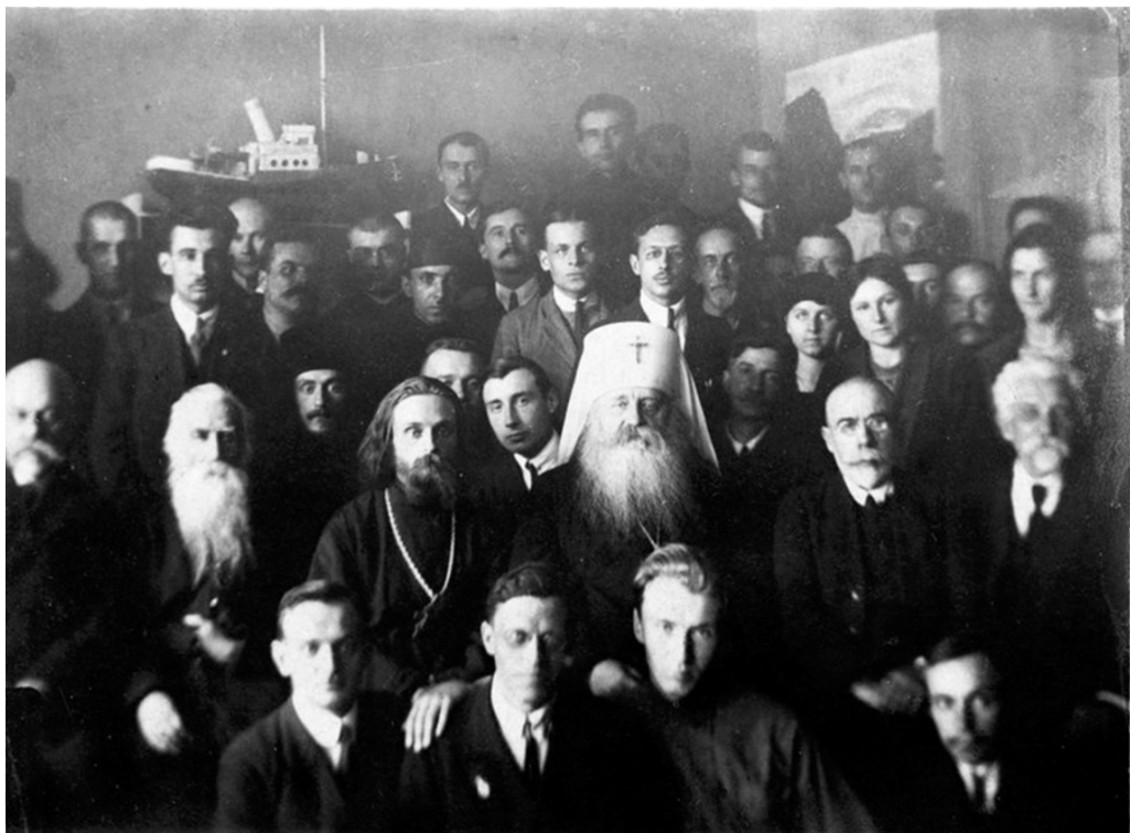
Митрополит Антоний среди русских студентов Богословского факультета Белградского университета. На обороте надпись: «Кружок русских студентов Богословского факультета Белградского университета в день своего открытия. 2/15 февраля 1924 г. в Белграде»

В Послании Мировой конференции от имени Русского Всезарубежного Церковного Собора 1922 г. владыка также напоминает пророчество Ф. М. Достоевского о том, что хотя революция начнется в России, ее подлинное гнездо будет в Европе 21 .