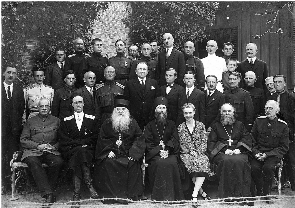
П. Н. Врангель с супругой Ольгой, митрополит Антоний и другие гости и постоянцы в «Здравнице имени генерала Врангеля» в Белграде в первый день Пасхи, 1927 г.

В начале 1930 г. Сербский Патриарх Димитрий, председатель Священного Синода Болгарской Церкви митрополит Климент и митрополит Варшавский и всея Польши Дионисий обратились к владыке Антонию с выражением сочувствия и сообщением об установлении молений о гонимых и страждущих за веру в Советской России.