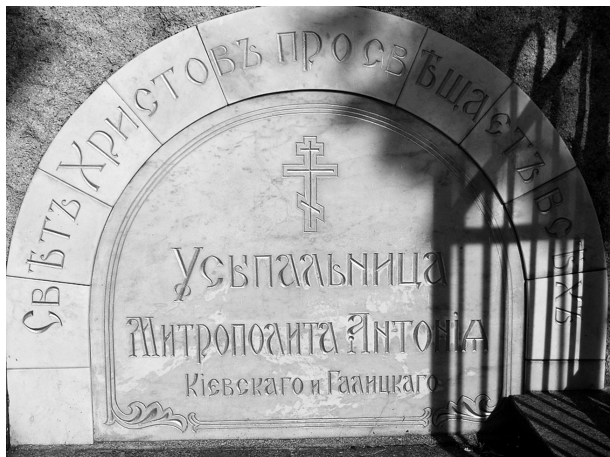
Могила митрополита Антония в крипте Иверской часовни на Новом кладбище Белграда

его священный завет о том, чтобы православная царская Россия была бы восстановлена во что бы то ни стало. В этом спасение всех нас. Это всегда чувствовал наш великий покойник, чувствую и я, чувствуете это и все вы. <...> Мы должны уберечь Русскую Церковь, рассеянную по всему миру в это страшное время, и до тех пор, пока я остаюсь на своем положении, я не допущу, чтобы хоть один волос упал с Русской Православной Церкви Заграницей. Таковы св. заветы из этого гроба». В тот же день митрополит был погребен в усыпальнице Иверской часовни на Новом белградском кладбище 110 .