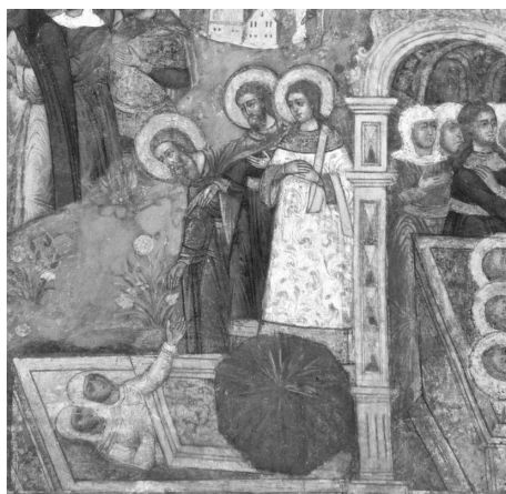
Ил. 1. Ярославль. Церковь Ильи Пророка. Придел мучеников Гурия, Самона и Авива. Фреска «Чудо с заживо погребённой Евфимией». 1680 г. 2017 г.

О «чести, чине и образце» для анэпиграфных надгробных валунов свидетельствовали переведённые на русский язык памятники византийской агиографии. Так, в Житии Гурия, Самона и Авива, включённом в Великие Четыи Минеи св. митр. Макария, есть рассказ о чуде с заживо погребённой отроковицей. Некий готский воин, будучи уже женат, во время похода вторично женился на Евфимии, поклявшись