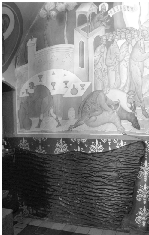
Ил. 3. Муром. Благовещенский монастырь. Церковь Благовещения. Надгробная плита свв. князей Муромских. Шокшинский песчаник. Фото А. Г. Авдеева. 2013 г.

и камень на не же блженныи сѣдѣше в животѣ своемъ. и погѣ гла к людемъ с моленіем велии, да полужатъ когти моѣ на се мѣсте, и камень той на немъ же азъ никѣ сеждѣ на моѣ могилѣ», что и было выполнено 16 .