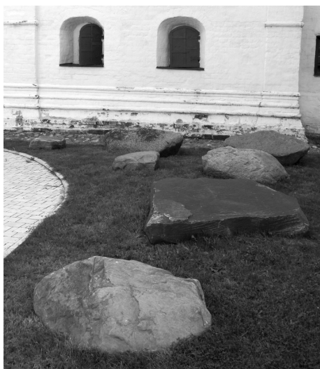
Ил. 2. Ярославль. Церковь Ильи Пророка. Валуны на территории церковного некрополя. 2012 г.

на могиле святых в верности новой супруге, но, привезя её домой, выдал за свою рабыню. Жена гота, заподозрив измену, решила отравить его сына, прижитого от Евфимии, но та отёрла яд на губах младенца куском шерсти и омочила его в кубке с вином, принадлежавшем хозяйке дома. Выпив из него, ревнивая супруга умерла, а её родственники, обвинив в её смерти Евфимию, «затвориша отроковицу во гробѣ, идеже положили бяху умершія тѣло; и положиша камень великъ верху гроба» 11 . Созданная артелью Гурия Никитина в 1680 г. фреска на северной стене придела Гурия, Самона и Авива в ярославской церкви Ильи Пророка изображает финальный эпизод чуда (Ил. 1). Явившиеся по молитвам Евфимии святые стоят у белокаменного саркофага, украшенного барочными узорами, поверх которого лежит красно-коричневый валун со светлыми прожилками, подобный камням, обнаруженным в 2010–2012 гг. во время работ по понижению грунта на территории храмового некрополя (Ил. 2).