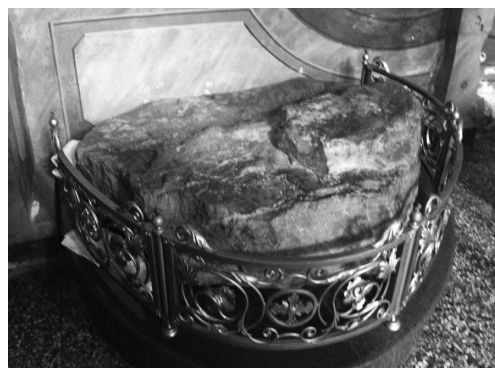
Ил. 4. Великий Устюг. Храм Прокопия Устюжского. Северный придел. Надгробие прп. Прокопия Устюжского. Песчаник с большим количеством примесей оксида железа. 2013 г.

поздней Пространной редакции Жития муромских князей указано, что «та дѣка стончѣ и донныи на нхъ мѣстѣ, ѿ нжныхъ страны оу црковныхъ стѣны». При строительстве нового каменного собора в конце XVII в. валун был вмурован в стену западной галереи (Ил. 3) 15 .