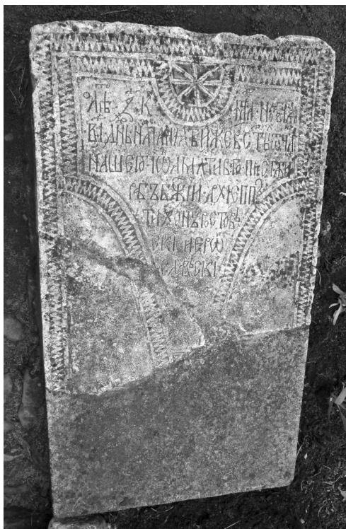
Ил. 7. Борисоглебский, что на Устье, монастырь (Ярославская обл. Борисоглебский р-н. Пгт. Борисоглеб). Белокаменная надгробная плита с эпитафией архиепископу Ростовскому и Ярославскому Тихону (Малышкину). 12 ноября 1511 г. Изд.: Авдеев А. Г. Надгробие архиепископа Ростовского и Ярославского Тихона // Вестник ПСТГУ. Сер. II. История. История Русской Православной Церкви. 2011. № 4 (41). С. 99–104.

обитатели умер не в 1509 г., а несколько позже, так как рябовский игумен Васьян упоминается в актовом документе вплоть до 1539 г. 22 Этому не противоречат названная в «Сказании...» толщина «гроба» подвижника — ок. 18 см., что типично для надгробий Московской Руси начала второй четверти XVI в. 23 Характерно, что после начала местного почитания прп. Вассиана надгробие сменила «гробница со крестом, над землею верху на локоть вышины, в подобии богоугодных мужей», говоря иначе — установленная над мощами рака высотой ок. 45 см 24 .