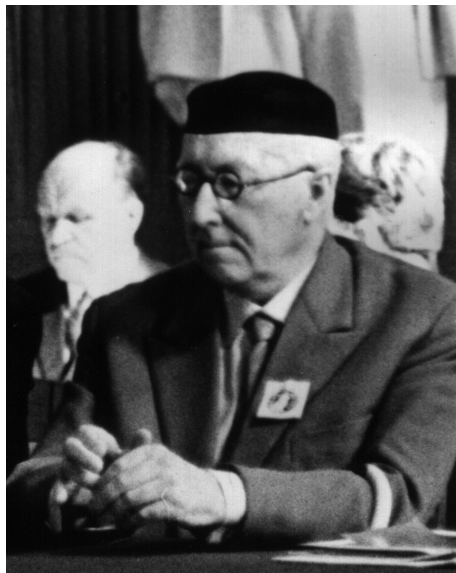
А. Ф. Лосев (монах Андроник) в своей неизменной черной шапочке, 1965 г. Некоторые полагали, что ее ношение — академическая традиция.

В заключение коснемся немного биографической перспективы рассматриваемой проблематики. Время жизни Лосева не предполагало возможности «подобного» (в неоплатоническом смысле) социального символа абсолютной мифологии — позднеантичного или средневекового монастыря. Однако окружающие его условия позволили (при всех биографических перипетиях) воплотить в жизнь «неподобный» символ. Идея абсолютной мифологии и ее практическое воплощение в монашестве