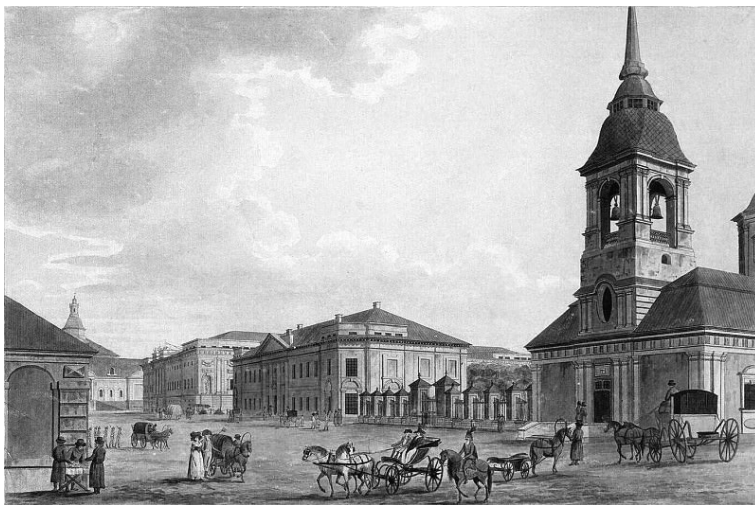
Молтон, Томас. Вид Литейного проспекта и Сергиевской церкви. 1790 г. Собрание Государственного Эрмитажа.