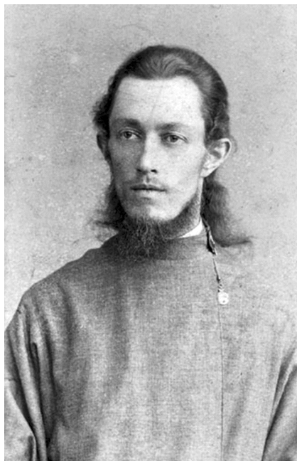
Священник Иосиф Фудель, 1892 г.

Следующей весной Фудель, хлопотавший о рукоположении, побывал, снабженный рекомендательными письмами Леонтьева, в столице и 17 мая 1889 г. рассказывал ему: