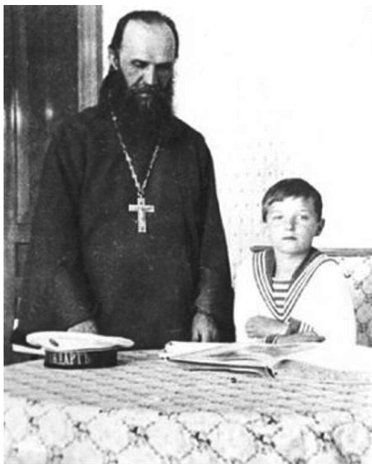
Протоиерей Александр Васильев с цесаревичем Алексеем, 1912 г.