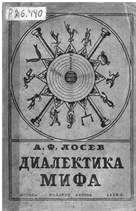
Первое издание «Диалектики мифа» А. Ф. Лосева (1930)