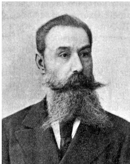
Клавдий Никандрович Пасхалов

Монархист, член «Русского собрания», почетный член «Русского монархического союза» Клавдий Никандрович Пасхалов (1843–1924) называл парламентские идеи западной демократии «западноевропейской отбраковкой» 49 , чуждой нам 50 . Соответственно, он считал, что России от них следует безоговорочно отказаться. Западный парламентаризм политик и публицист характеризовал как «лжепредставительство» 51 , называл «западным шутовством» 52 , которое обратилось в «самую дикую олигархическую тиранию» 53 . Конституционализм Запада общественный деятель называет «изношенной мишурой» 54 , считая его «грубым, фальшивым режимом арифметического деспотизма и счетоводной правды» 55 . Вслед за В. А. Грингмутом К. Н. Пасхалов признавал материальное, экономическое превосходство Европы: «нам впору только догонять ее, постоянно уходящую вперед» 56 . Однако