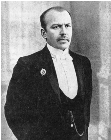
Павел Федорович Булацель

П. Ф. Булацель о «плутократическом произволе» западноевропейской демократии. Согласно с другими монархистами в оценках западноевропейского парламентаризма и активный деятель монархических организаций — «Русского собрания», «Союза русского народа» и «Русского народного союза имени Михаила Архангела» — Павел Федорович Булацель (1867–1919). Он считал, что конституционализм Запада сам по себе пагубен, и это обстоятельство постепенно осознает даже само западное общество. Парламентаризм приводит к тому, что «парламентская болтовня и партийные интриги» не дают никакого счастья широким народным массам. Выгодополучателем от западной демократии является «небольшой кружок политиканов», которые захватывают власть и управляют странами Европы путем «подкупов, избирательных мошенничеств и разных интриг», «высасывают все средства из народа, непосвященного в эту чудовищную игру» 59 . Ссылаясь на авторитет