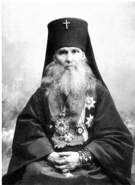
Святитель Макарий (Парвицкий-Невский)

Митрополит Макарий (Парвицкий-Невский) о духовном разложении Запада. В отличие от Н. Е. Маркова, почетный председатель Томского губернского отдела «Союза русского народа» святитель митрополит Макарий (Парвицкий-Невский; 1835–1926), наоборот, попытался определить причины духовного кризиса западной цивилизации. В своей рождественской проповеди, изданной под названием «Поворот в христианском мире к язычеству. Слово в день Рождества Христова» он коснулся обстоятельств духовного разложения Запада, считая, что поворот к кризису западной цивилизации начался в XIV–XVI вв. Эпоху Возрождения митрополит рассматривал, прежде всего, как отказ от христианских ценностей и обращение к язычеству. В результате угас