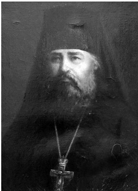
Архимандрит Антоний (Храповицкий). Худ. Н. А. Мухин, середина XX в.

В статье 1895 г. «Паписты и толстовцы: две крайности» о. Антоний отмечает, что католики неверно истолковывают единство, проповедуемое Христом в Первосвященнической молитве: Да будут все едино, как Ты, Отче, во Мне, и Я в Тебе, так и они да будут в Нас едино (Ин 17:21). Они понимают единство как унию, т. е. как обращение «схизматиков», как чисто внешнее объединение «в смысле общей административной подчиненности папе» 13 . По мнению о. Антония, идея Рима (как языческого, так и католического) состоит в идее всемирной империи и вселенского господства. Он отмечает, что Первосвященническая молитва свидетельствует о сущностном, реальном единстве человечества — подобно лицам Святой Троицы: «Молитва эта была не о чем ином, как об устройении на земле нового, единого бытия Церкви, бытия, донныне чуждого разделенному грехом человечеству... Это бытие имеет себе подобие не на земле, где нет единства, а лишь разделение, но на небе, где единство Отца и Сына и Святого Духа совершает трех Лиц в единое Существо, так что уже нет трех богов, но Единый Бог, живущий единою жизнью. Точно так же единое новое бытие,