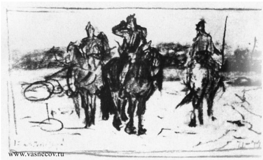
Илл. 3. Васнецов В. М. Богатыри. 1-ый эскиз. 1871-1874. Б., уг. кар. ГТГ

в столицу Франции, он не только изучал собрания местных музеев и экспозиции произведений современных европейских живописцев в галереях, сколько рисовал и писал с натуры, в том числе в окрестностях Парижа, в Медоне, и разрабатывал эскиз полотна, ставшего одним из центральных в его творчестве — «Богатыри», в котором уже ясно обозначена его итоговая композиция, намечены характеры персонажей. Отметим, что первый беглый набросок «Бо-