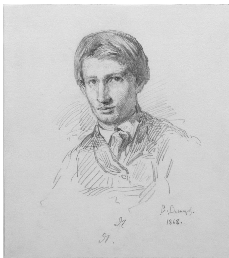
Илл. 4. Васнецов В. М. Автопортрет. 1868. Б., гр. кар. ДМБ

Важно также обозначить место духовно-творческого наследия В. М. Васнецова в настоящее время. Эрих Фромм писал о неизбежном нарастании кризиса духовных ценностей, о коммерциализации всего общества 21 , когда усиливаются процессы дезинтеграции, межэтнические конфликты, национализм, экстремизм, терроризм, религиозный фанатизм, экспансия западных образцов массовой культуры... По заключению А. Вебера, культура динамична, но в ее бытии неизбежно наступает момент остановки 22 . Нельзя не признать