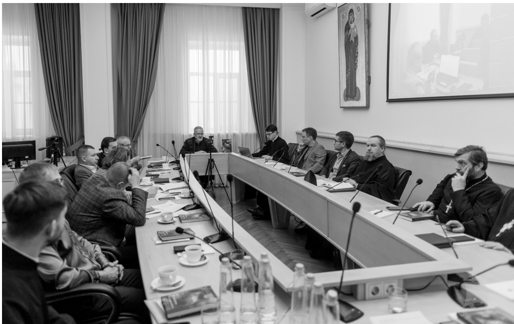
08.12.2023. Барсовские чтения

Самими же участниками мероприятия было отмечено, что терминологические конструкции «состязательность» и «обвинительность» используются ими без конкретизации содержания.