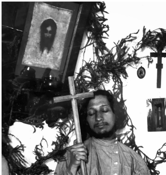
Священник Павел Александрович Флоренский (1882–1937)

Ключевой тезис Флоренского — происхождение платонизма из магического мировоззрения непосредственного сознания, и, соответственно, можно говорить об интерпретации платонизма как теургии . Платон-заклинатель заклинал слова своих писаний некоей силой, так что и «по исходе тысячелетий, они все еще волнуют сердца странным волнением и жгут их сладкою болью, и томят, и влекут в еле зримую, брежжущую в холодных предутренних туманах даль. Чем-то мистериальным благоухают его священные речи, исполненные божественной мании. Так