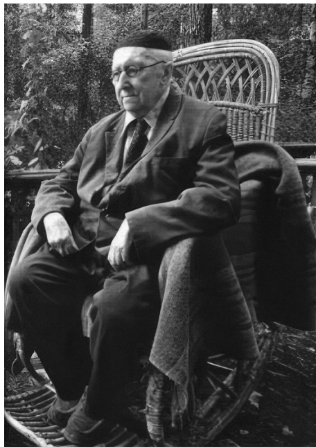
Алексей Федорович Лосев (в монашестве Андроник; 1893–1988)

Отношение Лосева к Платону и платонизму ввиду его самоопределения в православной ортодоксальности и желания согласовать по сути своей несогласуемое —