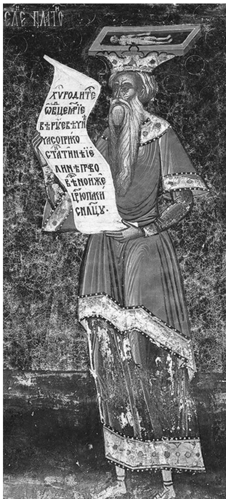
«Эллин Платон» на фреске православного монастыря Сучевица (Румыния), XVI в.

На основании проделанного анализа предложена оригинальная модель трансформации образа Платона и его философии в соответствии с развитием интеллектуальных запросов общества и индивидуальными особенностями интерпретаторов —