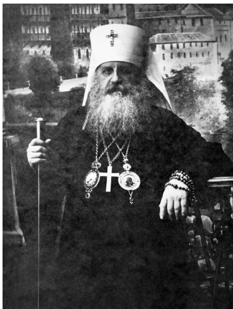
Портрет владыки Антония (Храповицкого), сделанный в фотоателье Пантелеимоновского монастыря, 1920 г.

Владыка Антоний (Храповицкий), будучи в сане архиепископа Вольнского, принял живейшее участие в остром споре вокруг Имени Божиего, разгоревшемся сначала на Святой Афонской Горе, а затем — во всем Русском Православии. Более того, его роль в этом драматическом эпизоде истории Русской Православной Церкви можно назвать ключевой.