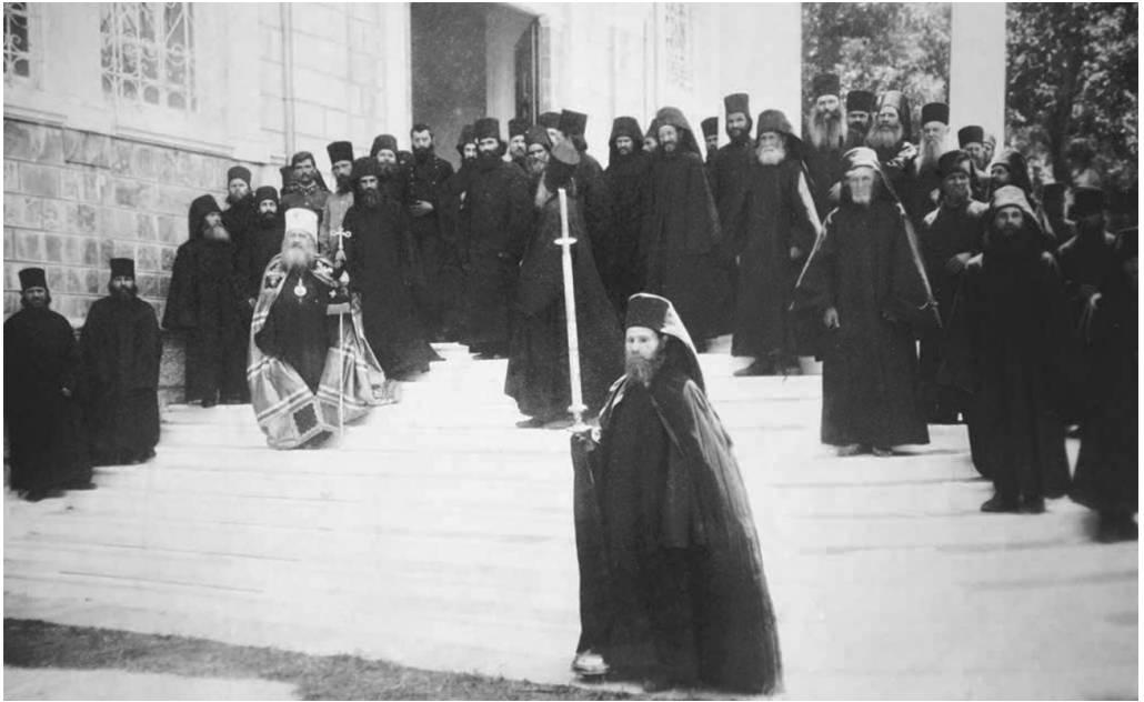
Владыка Антоний на освящении храма в Нагорном Руссике, 27 июля 1920 г.

он произнес знаменательные слова о том, что «давно надумал оставить кафедру и поселиться на Афоне, и даже писал старцам о принятии его в обитель, но разные церковные дела и проекты заставляли его откладывать свое намерение, но вот теперь, после понесенных трудов на Соборах, когда церковные дела более или менее устроены, а светская власть перешла к большевикам, он твердо решил ехать на Святую Гору и жить здесь долго, пока не позовут обратно в Россию. „Я приехал к Вам не как святитель, а прошу принять меня как простого инока“, — и с этими словами он сделал земной поклон братии» 16 .