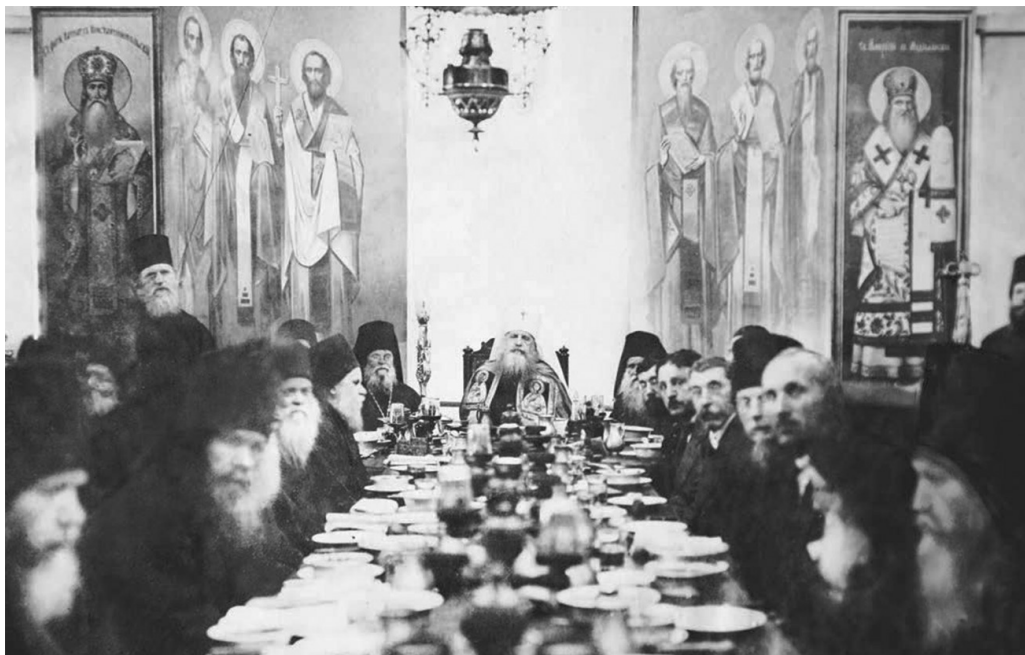
Владыка Антоний в трапезной Пантелеимоновского монастыря, 23 апреля 1920 г.

Можно с основанием предположить, что владыка и его афонский корреспондент все-таки встретились. Весной 1920 г. митрополит вместе с частями армии Деникина эвакуировался из Новороссийска в Грецию. Праздник Благовещения он справил у о. Сергия (Дабича) в Афинах, где тогда пребывал и Павловский.