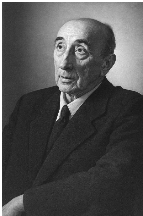
Михаил Михайлович Бахтин (1895–1975)

Восприятие М. М. Бахтина как теоретика множественности сознаний сохранялось вплоть до публикации в 1986 г. его ранней работы, которую условно назвали «Философией поступка». Концепт «не-алиби в бытии» и само понятие «поступка» как первичной целостности человеческого бытия, его сущностного истока, который лишь теоретически может раскладываться затем на свои отдельные содержательные компоненты (в виде морального действия, эстетического сознания и познавательной активности), также стали своего рода «революцией» в философском сознании того времени — даже несмотря на то, что оно к концу советского периода уже было достаточно искушенным в различных западных философских течениях. Здесь Бахтин был, в первую очередь, близок к философии экзистенциализма: «не-алиби в бытии» фактически является чистым смысловым эквивалентом Dasein М. Хайдегера. Этот текст в то время был чрезвычайно цитируемым — не в меньшей степени, чем ранее был очень цитируемым текст «Проблем поэтики Достоевского».