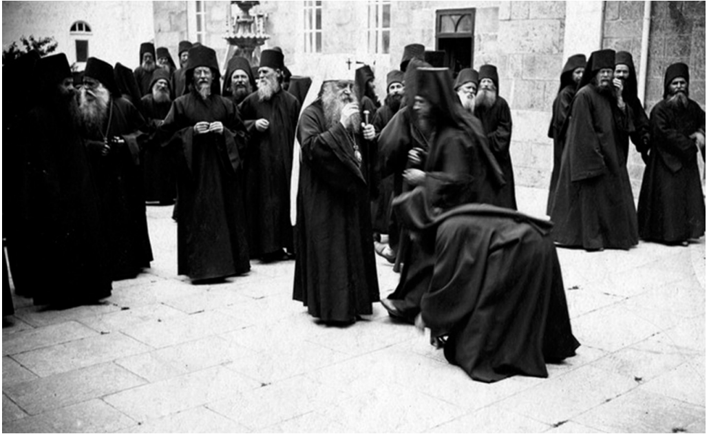
Митрополит Антоний в Пантелеймоновском монастыре на Афоне, апрель 1924 г.

ноябрь-декабрь 1921 г.). Вскоре митрополит возглавил «Высшее русское церковное управление за границей» (ВРЦУ), образованное Собором. В течение 15 лет митрополит Антоний являлся председателем Собора архиереев и Архиерейского Синода РПЦЗ, с 1931 г. по решению Архиерейского Синода РПЦЗ носил титул «Блаженнейший». На Соборе РПЦЗ были приняты различные документы с резкой критикой советской власти. Вскоре после этого, 5 мая 1922 г., вышел указ от имени Святейшего Патриарха Тихона, согласно которому ВРЦУ было упразднено. Одновременно подтверждалось каноническое право митрополита Евлогия (Георгиевского) на управление православными русскими приходами в Западной Европе 11 . 10 ноября 1923 г. последовал новый указ от имени Патриарха Тихона, которым это решение еще раз подтверждалось. Этим указом руководящие органы РПЦЗ во главе с митрополитом Антонием не подчинились.