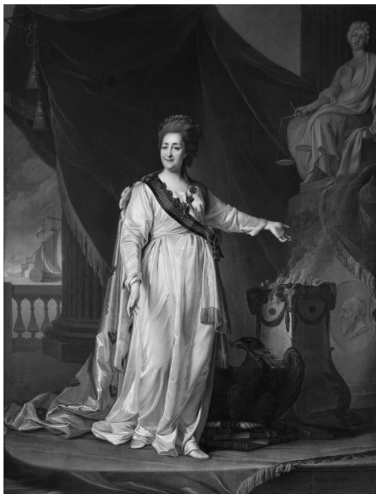
Портрет Екатерины II — законодательницы в Храме богини Правосудия. Худ. Д. Г. Левицкий, 1783 г.

Гримму на то, что ее долголетняя мечта вот-вот осуществится. Ушаков теперь угрожает самому Константинополю и намерен довершить разгром османского флота именно там. В действительности же, как отмечалось, боевые результаты победы при Калиакрии были, увы, менее значительными.