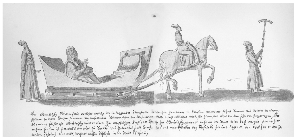
Рис. 1. Митрополит Сарский и Подонский Питирим во время выезда, середина XVII века (Рисунок опубл.: Альбом Мейерберга. Виды и бытовые картины России XVII века. Объяснительные примечания к рисункам. СПб., 1903. С. 109. № 68)

Первая поездка, сведения о которой мы имеем, предпринятая зимой 1694–1695 гг., неплохо обеспечена источниками. Прежде всего, мы должны назвать сибирские