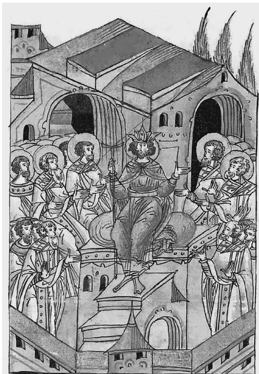
Вѣтгошестипогособора, иже и трулль прѣ- вило ест. Прїеѣду и въ хоуриисоградъ достѣи поспѣ четиридесятницы двѣ

Миниатюра Лицевого летописного свода с изображением Трулльского Собора 691–692 гг., 1560–1570-е гг. Этот Собор, считающийся продолжением VI Вселенского, называют Пято-Шестым, чтобы таким образом символически обозначить присутствие в каноническом корпусе правил всех Вселенских Соборов