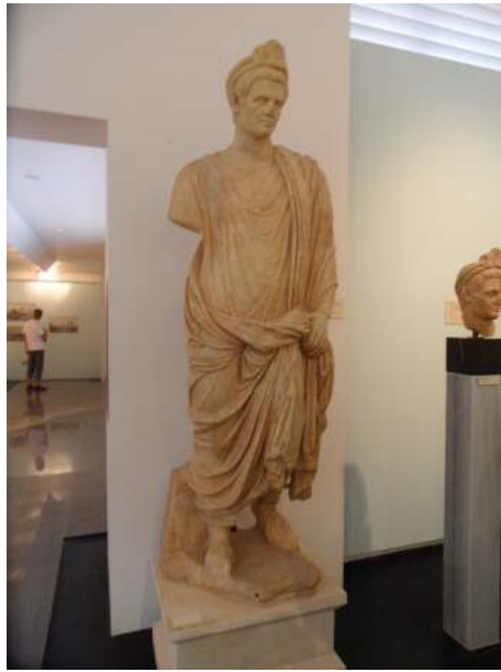
Рис. 4. Жрец императорского культа (Музей г. Афродисиас)

надцать городов, с одинаковою настойчивостью, но не с равными основаниями. Все они опирались на сходные доводы, ссылаясь на свое древнее происхождение, на преданность римскому народу в войнах с Персеем, Аристоником и другими царями. Но Гипепа, Тралла и вместе с ними Лаодикея и Магнесия сразу же были отвергнуты, как города незначительные. В отношении пергамцев было сочтено, что с них довольно существующего в их городе храма Августа, хотя именно это и было их главным доводом. Милет и Ефес отпали, потому что первый и без того совершает священнодействия Аполлону, а второй — Диане (Артемиде). Итак, оставалось выбрать лишь между Сардами и Смирной. Жители Сард упоминали о грамотах, данных им нашими полководцами, о заключенных с нами во время Македонской войны договорах, протекающих у