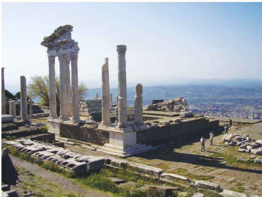
Рис. 6. Руины храма императора Траяна в Пергаме

серьёзная проблема — вкушение такого мяса рассматривалось как идолослужение. Беднейшие слои языческого общества питали отвращение к христианам за их отказ участвовать в культе, так как это означало то, что какие-то граждане города отвергали богов-покровителей, которые, в свою очередь, будут мстить городу за непочитание всяческими бедствиями.