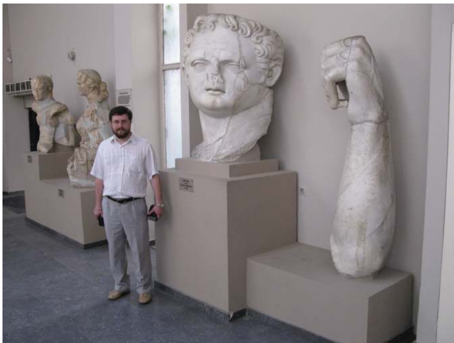
Рис. 5. Фрагмент семиметровой статуи Домициана, установленной при жизни в его храме (Ефесский археологический музей)

торжествах извещалось отдельно. Ритуал императорского культа соблюдался во всех мелочах и проходил с обязательным участием всех жителей — каждый лично должен был засвидетельствовать свою лояльность. Наряду с официальными днями отдыха, дни почитания императора также объявлялись выходными 20 .