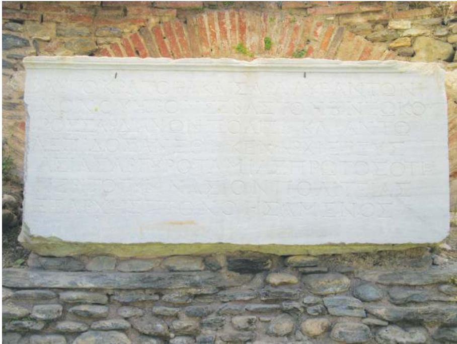
Рис. 3. Мраморная дарственная плита о даровании городу Сардису статуса «неокорос» (хранитель храма) от императора Антонина Пия

Порой против иудеев возникали локальные гонения — известно письмо Цицерона «В защиту Луция Валерия Флакка» 7 , в котором он оправдывает малоазийского губернатора Флакка, арестовавшего годовую десятину фригийских евреев для Иерусалимского храма — 15 000 серебряных драхм. Эти деньги Флакк пытался изъять в неурожайный для Фригии 62 г. до Р.Х., но Рим приказал воздержаться от притеснений иудеев.