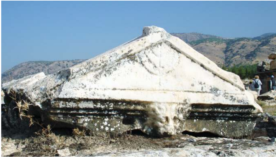
Рис. 1. Иудейский саркофаг в некрополе Иераполя Фригийского

Иосиф Флавий также сообщает, что император Август Октавиан издал закон, согласно которому иудеям было разрешено собирать деньги (десятину) для Иерусалимского храма и иметь своё судопроизводство (Иудейские древности. 14) 5 . Иудеи в глазах римской власти были абсолютно легитимны, и, более того, есть примеры, подтверждённые археологическими раскопками, что порой синагоги строились на деньги римской власти. Наглядным доказательством этой удивительной лояльности римских властей к иудеям (и, естественно, наоборот) может служить возведённая во II в. синагога в Сардисе, не уступающая размерами храму Артемиды и построенная благодаря материальной поддержке римской власти.