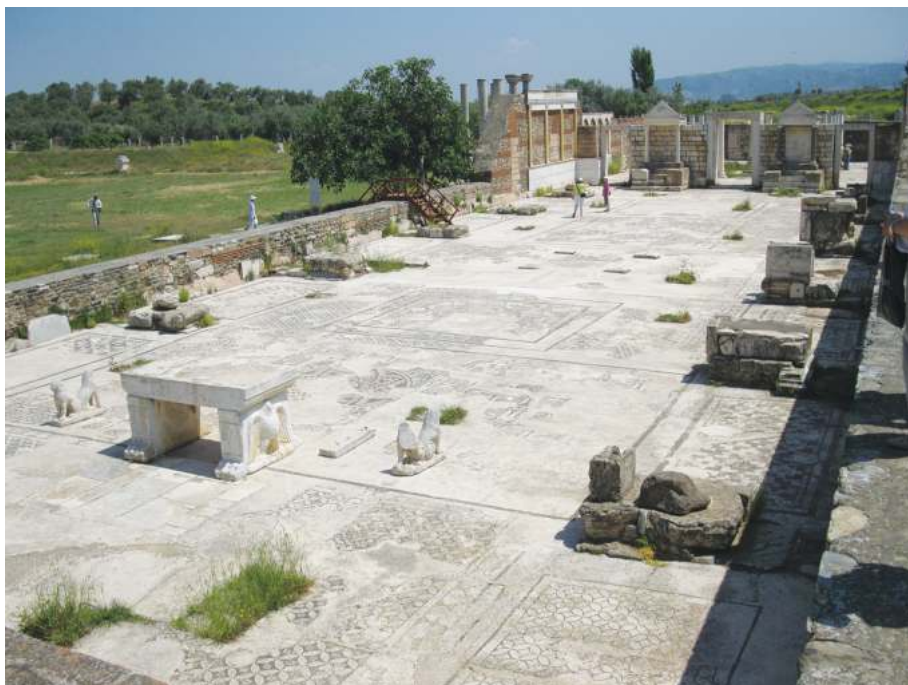
Рис. 2. Синагога в Сардисе, построенная во II в. по Р.Х.

археологами — чётко прочтываются восемь римских чиновников консульского ранга, один прокуратор и один имперский финансовый администратор, а на стене синагогального комплекса находится памятная мраморная доска сообщающая, что император Аврелий Антонин (Антонин Пий, 138–161 г. по Р.Х.) дарует городу Сардису титул «неокорос» (хранитель храма). Этот титул давался городу за особую лояльность к Риму и за строительство храма (в данном случае синагоги), который выступал в роли идеологического центра римской власти 6 .