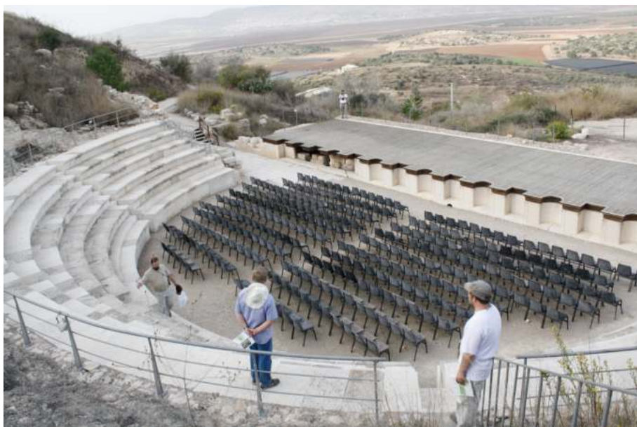
Рис. 4. Театр в Сепфорисе

I в. (Дж. Стрэндж и К. Томас Макколло) 41 и конец I в. или позднее (Эрик и Кэрл Мейерсы, Эхуд Нецер, Зеев Вайс) 42 . Последняя датировка доминирует. Возможным вариантом решения проблемы датировки театра могла бы быть позиция Р.Л. Бейти: было две фазы строительства театра. В период Антипы, видимо, был создан маленький театр, приблизительно на 3 тыс. зрителей. Позднее достроен 3-й ярус, добавлена внешняя стена, которую на основе строительного метода У. Олбрайт датировал II в.