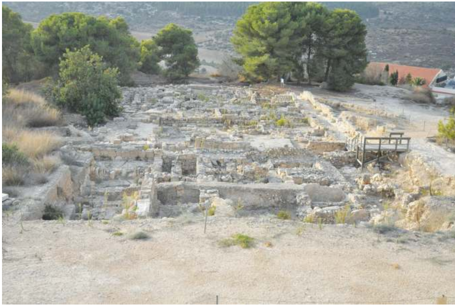
Рис. 2. Жилой квартал в Сепфорисе

ния Галилеи, и, в частности, Сепфориса. Город в I в. преимущественно был населен евреями.