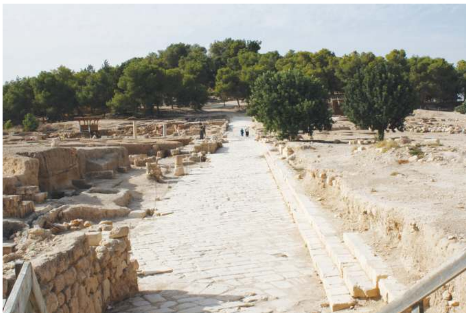
Рис. 1. Декуманус в Сепфорисе (византийский период)

Римской империи 32 . Улицы, по крайней мере, две ранние, проложены по сетке римских образцов. Открыты многочисленные инсулы, на акрополе найдено прямоугольное здание с бассейнами 33 . Один из акведуков города и базилика на восточном плато также датируются I в. по Р.Х. 34