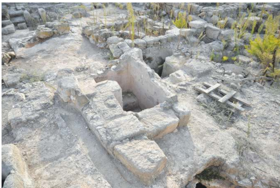
Рис. 3. Миква в жилом квартале Сепфориса

так как ранние слои полностью разрушены более поздними постройками. Поэтому хронология восстанавливается только в самых общих чертах. Нет эллинистического или хасмонейского слоев, хотя в засыпках находят хасмонейский материал, что все-таки позволяет предположить, что район был заселен, по крайней мере, в хасмонейский период, если не ранее 35 . Западный холм, таким образом, представляет собой «старый город», восходящий ко времени Антипы. Максимального размера город достиг уже несколько позже.