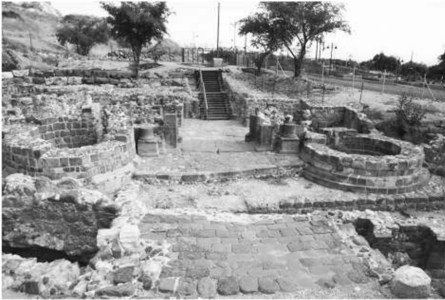
Рис. 6. Южные ворота в Тивериаде 61

коративные опоры под колоннами из великолепно обработанного черного базальта. Исследователи не исключают, что этот комплекс мог быть автономной монументальной структурой, так как смежные стены и комнаты не дали материалов ранее VI–VII вв.