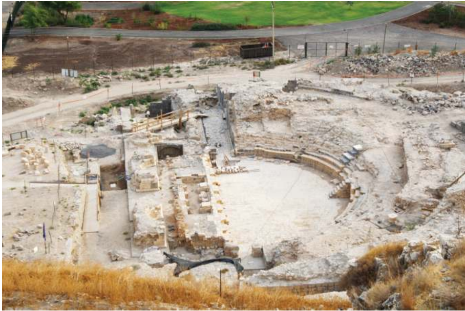
Рис. 8. Вид на театр Тивериады с горы Береники

строительства знаменитого театра в Сепфорисе, датируемого многими временем после 70 г. 72