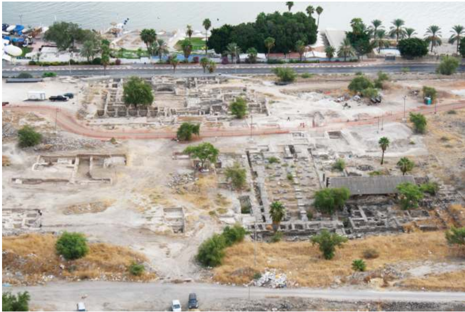
Рис. 7. Вид с горы Береники на древнюю Тивериаду

сожалению, на основании керамики из шурфа terminus ante quem установить не удалось. Глиняная посуда, найденная выше пола, давала его датировку не позднее I–II вв. Й. Хиршфельд сделал вывод, что это остатки роскошной виллы начала I в., и отождествил ее с дворцом Антипы 67 .