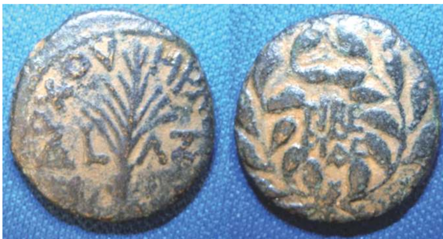
Рис. 9. Монета Антипы

выпущены в критический момент борьбы за власть с Агриппой с целью обретения благосклонности императора) имя Ирод на аверсе написано в именительном, а не в родительном падеже, на реверсе впервые появляется имя императора в дательном падеже, то есть «Ирод тетрарх Гаю Цезарю Германику».