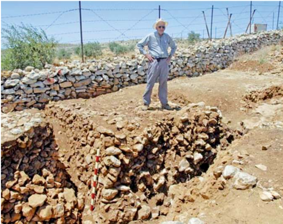
Рис. 5. Стена крепости в Хирбет эль-Макатире в западной части сохранилась высотой до 1,2 м 28

7) ворота на севере Гая (Нав 8:11) соответствуют северным воротам указанной крепости;