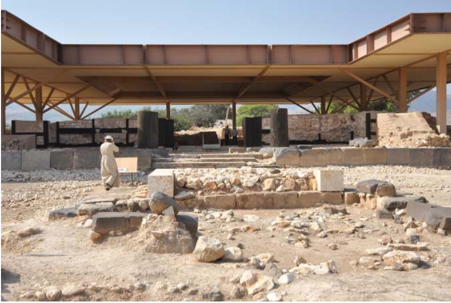
Рис. 6. Дворец в Хацоре

сл. четвертью XIII в. и связал его с деятельностью Иисуса Навина 34 , что соответствует поздней датировке вхождения евреев в Ханаан.