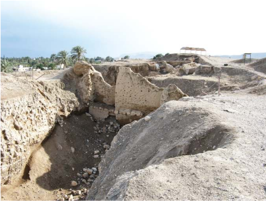
Рис. 1. Раскоп в Иерихоне

ней бронзы (примерно 1550 г. до Р.Х.) 13 . Эта датировка К. Кеньон стала считаться окончательной и стала приводиться как хрестоматийный пример несоответствия библейского повествования научным данным 14 . Окончательные отчеты раскопок К. Кеньон в Иерихоне были опубликованы только в 1981–1983 гг. (после ее смерти в 1978 г.) 15 . В начале 1990-х гг. Б.Г. Вуд (B.G. Wood) проанализировал эти отчеты, сопоставив их