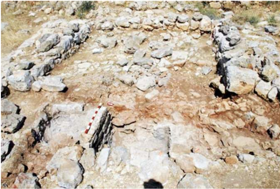
Рис. 4. Ворота в Хирбет эль-Макатире 24

возможность исследователям предположить, что идентификация Гая с et-Tell не является корректной 25 .