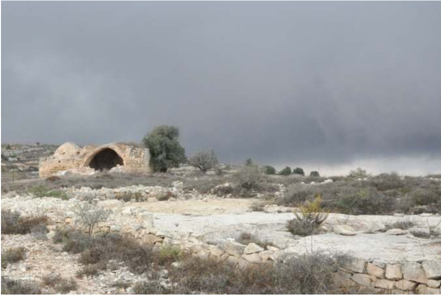
Рис. 2. Бейтин (Beitin)

жены в качестве кандидатов библейского Гая: Khirbet Haiyan (на юг), Khirbet Khudriya (на восток) и et-Tell (на северо-запад) 18 . Наиболее предпочтительным из всех кандидатов стал et-Tell, поскольку этот вариант идентификации поддержал У.Ф. Олбрайт 19 . Однако раскопки показали, что данное место не было заселено в период между 2400 и 1220 гг. до Р.Х. 20 Каменные постройки периода железа I в et-Tell рассматриваются некоторыми исследователями как свидетельство поселения там изра-