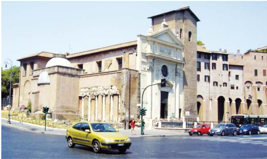
Рис. 3. Церковь св. Николая Чудотворца «в темнице». Рим

Слово же Миранда произошло, как полагают, от понятия благотельница.