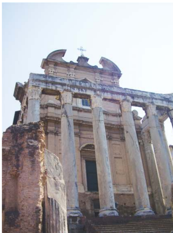
Рис. 2. Храм Антонина и Фаустины. Рим. Форум

Лоренцо-ин-Миранда. В настоящее время к храму ведет лестница с кирпичным алтарем по центру. Пронаос, предвещающий вход в храм, образован коринфскими колоннами из мрамора с прожилками — шесть по фасаду и по две боковых. На некоторых колоннах выгравированы изображения божеств; на фризе — грифоны и растительные мотивы. В VII в. храм был переделан в христианскую церковь 8 . Считается, что на этом месте был замучен Святой Лаврентий, от чего и произошло название церкви.