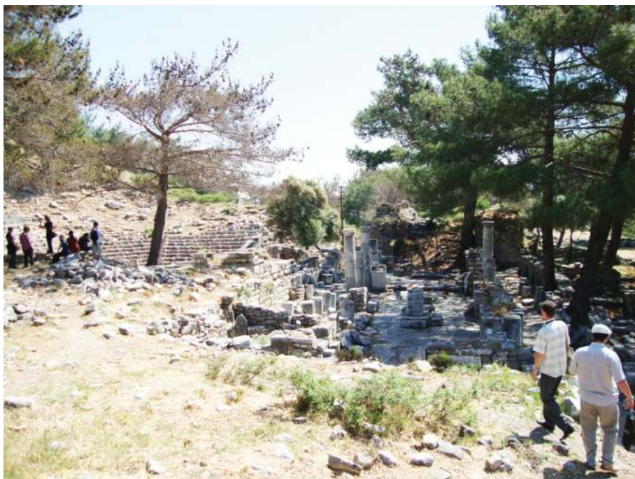
Рис. 8. Церковь и примыкающий к ней театр в Приене

во многих других известных городах Малой Азии, однако прямых доказательств этому нет в нашем распоряжении.