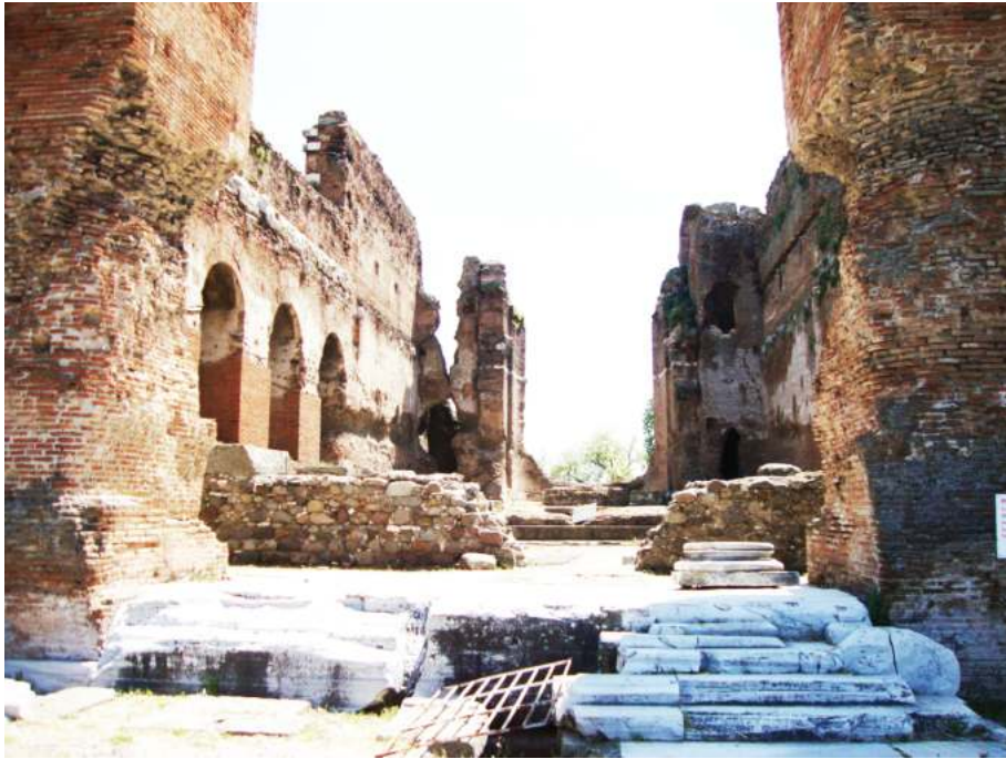
Рис. 6. «Красный двор» в Пергаме

тельствовать и в пользу того, что непосредственно в пределах языческого храма могли совершаться христианские богослужения.