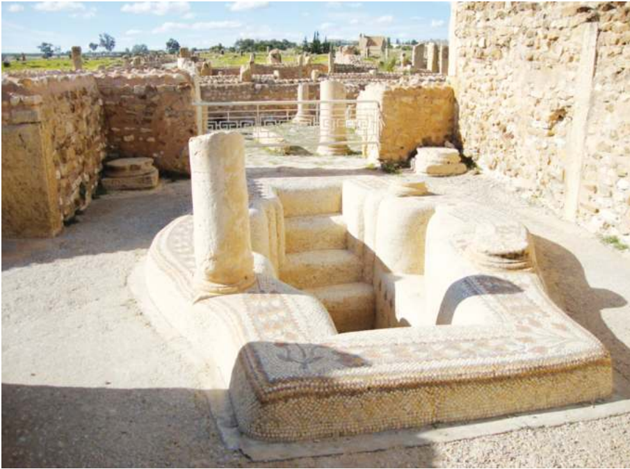
Рис. 10. Баптистерий вблизи языческого центра в Суфетуле

не было установлено господство арабов. Впрочем, арабы быстро забросили Суфетулу и в этих местах снова стали обитать кочевники-берберы.