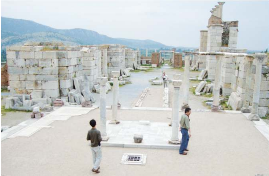
Рис. 4. Храм Иоанна Богослова в Ефесе

ности. При Юстиниане решено было покончить с последними напоминаниями о былом величии языческой богини, и руины храма Артемиды были использованы на строительство храма Святой Софии в Константинополе, а также, видимо, и самого храма Иоанна Богослова. Вероятно, возведение столь грандиозного сооружения, каким стал храм Иоанна Богослова в Ефесе, имело целью подчеркнуть своей монументальностью превосходство над языческим чудом света, которое, по словам Плиния Старшего 14 , имело «всего» 105 м в длину и 51 м в ширину, а ионические колонны, обрамлявшие святилище, достигали 18 м в высоту.