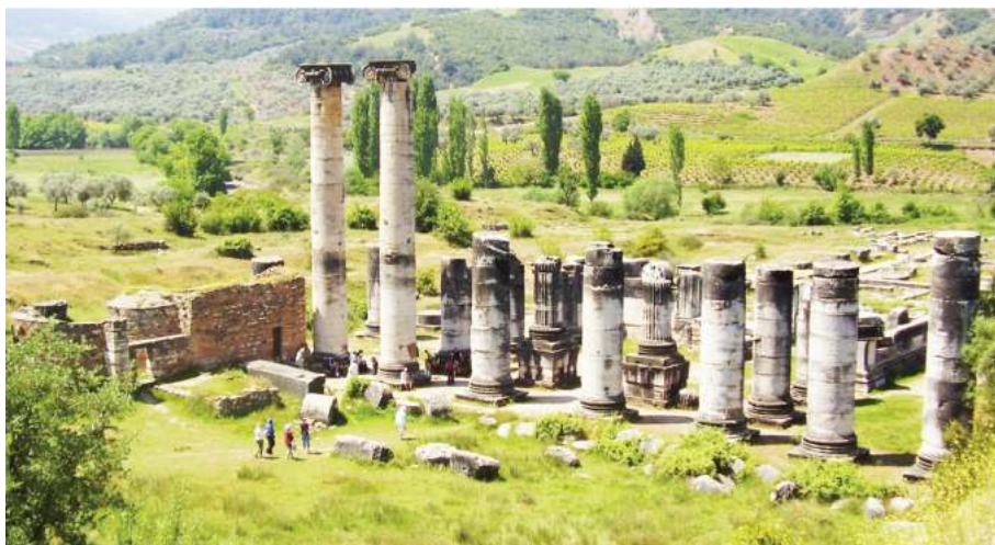
Рис. 5. Храм Артемиды в Сардах

стианская община была здесь не такой богатой и многочисленной, как в Ефесе. Тем не менее, уже в IV в. в непосредственной близости с языческим храмом христиане возводят небольшую базилику, не демонстрируя никакого намерения превзойти монументальностью античное творение. Вместе с тем, близость языческого святилища заставила христиан оградить себя от возможного «влияния» со стороны «демонов», которые ассоциировались с языческими культурами. С этой целью входы в сакральную часть Артемиды и само внутреннее пространство святилища были наполнены христианскими знаками и текстами. Прежде всего, это чёткие, прорезанные в мраморе кресты, напоминающие изображение голгофы в православной традиции, а также обрывки фраз, указывающие на влияние Евангелия св. Иоанна Богослова — «жизнь» (ζωή) и «свет» (φῶς). Сам же храм, как считают исследователи, так и не был никогда превращен в церковь, хотя наличие «охранных» христианских надписей может свиде-