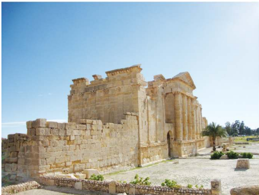
Рис. 9. Храм Капитолийской Триады в Суфетуле. Тунис

обращенной на юг и выходящей на форум, но представлял собой единый фасад, обращенный к северной части города.