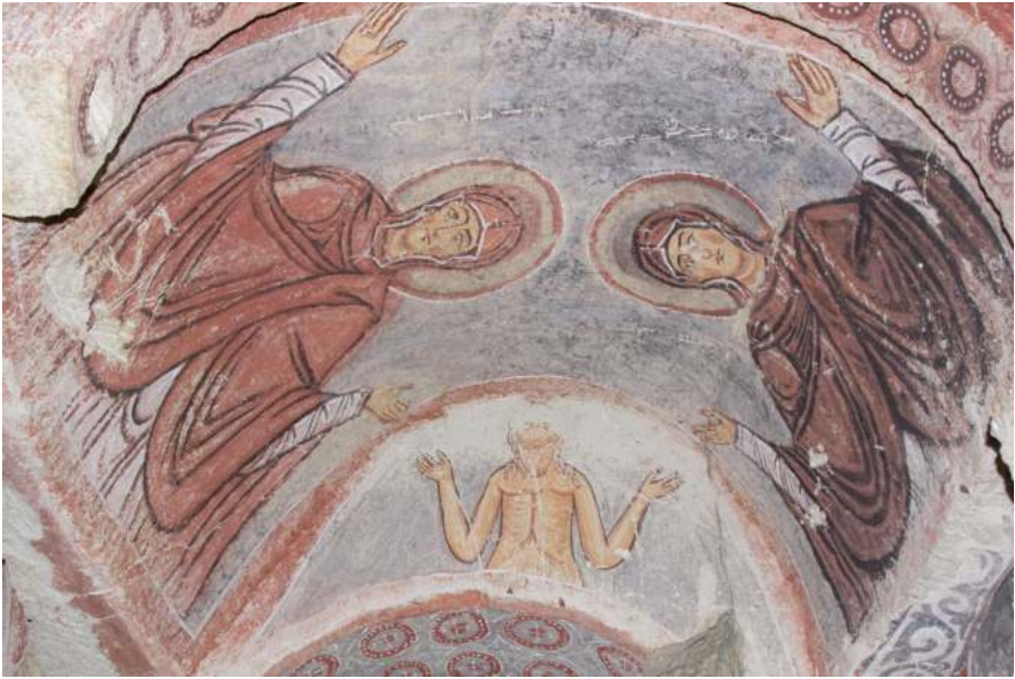
Рис. 14. Меримана-килисеси в Гереме. Перв. пол. XI в. Свв. Анна, Параскева и Онуфрий

Наиболее интересные примеры — так называемые церкви на четырех колонках в Гереме: Каранлык 48 , Чариклы 49 и Эльмалы 50 . По своей архитектурной композиции они соответствуют наиболее распространенному в это время типу