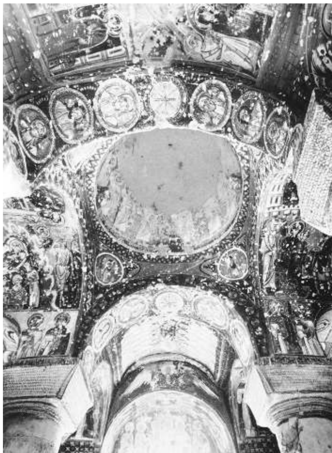
Рис. 9. Кылычлар-килисе. Нач. X в. Общий вид интерьера

В алтарной части изображены, в основном, святители: их фигуры размещены в нижней зоне апсиды и софитах алтарной арки 35 . В восточной и западной подпрудной арке по сторонам от центрального купола изображены пророки в