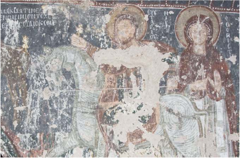
Рис. 8. Церковь св. Иоанна (Айвалы) в Гюллю-Дере. 913–920 гг. Погребальная капелла. Южная стена: свв. Евстафий и Феопистия, далее — святые жены

к началу X в. 34 Мы присоединяемся к точке зрения последних. Архитектура храма более сложная, чем все рассмотренные ранее варианты: это высеченное в скале воспроизведение крестово-купольной конструкции на четырех колонках. Вследствие этого и программа росписей гораздо более разветвленная и при этом хорошо структурированная.