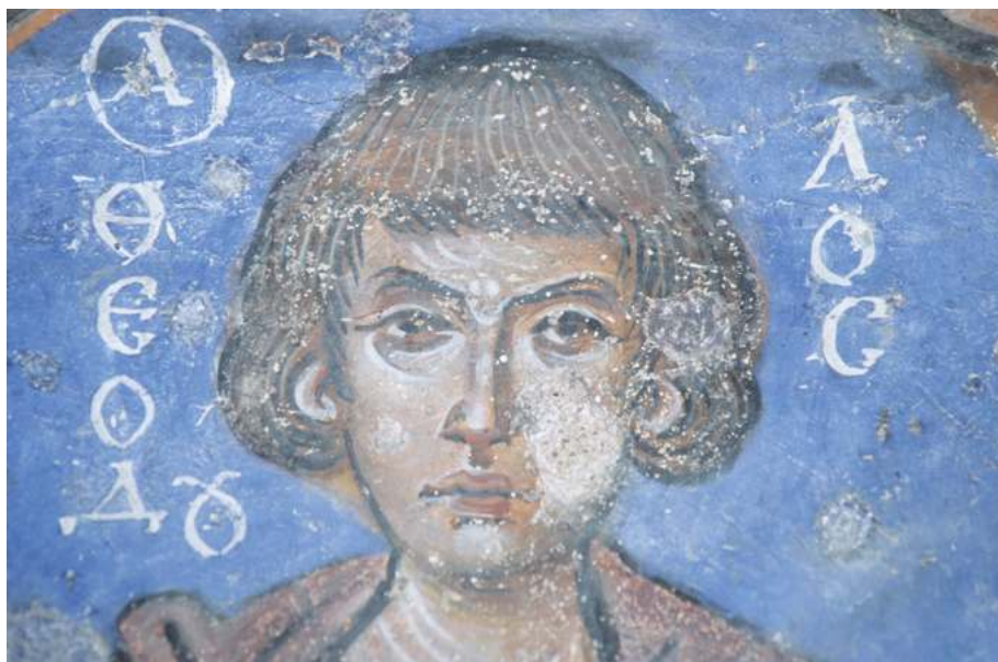
Рис. 12. Новая церковь Токалы в Гереме. 950-е гг. Св. Феодул

донского ренессанса, тогда как в иконографической программе есть целый ряд специфических каппадокийских черт.