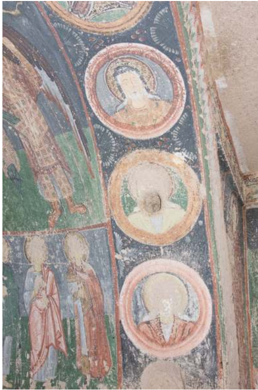
Рис. 6. Кызыл-Чукур. Хачлы-килисе. Нач. X в. В нижней зоне апсиды св. апостол Фома и св. Кирик. В софите арки медальоны с пророками

ны в западной части стены. В нижней зоне южной и северной стен представлены мученики без дифференциации внутри этой категории.