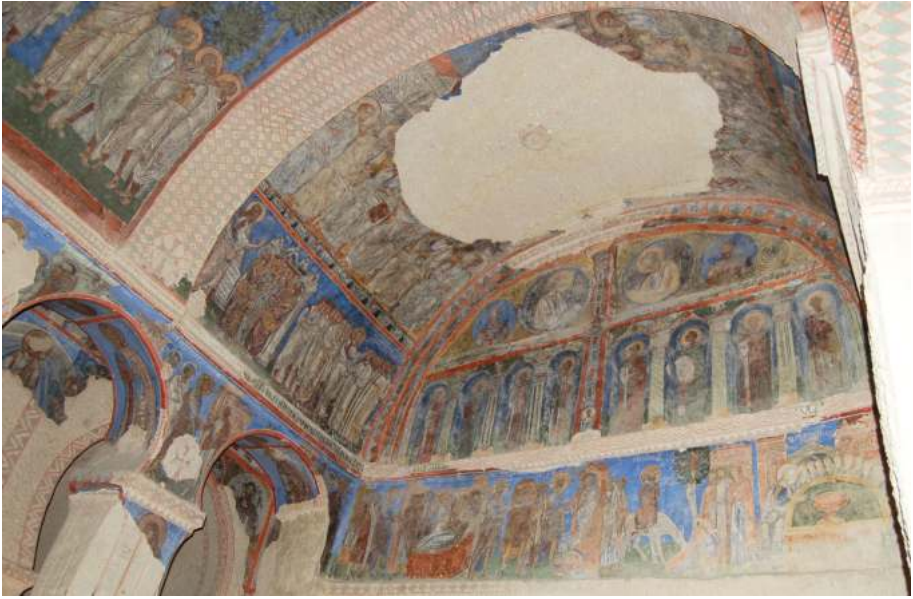
Рис. 11. Новая церковь Токалы в Гереме. 950-е гг. Вид южной части нефа

чеников. Святые были изображены также в нижних частях стен, однако из них сохранились немногие 38 .