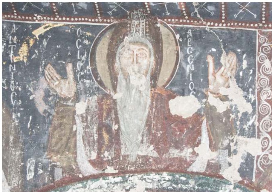
Рис. 7. Церковь св. Иоанна (Айвалы) в Гюллю-Дере. 913–920 гг. Погребальная капелла. Южная стена: преподобные

запад идут сначала фигуры святителей (свв. Григорий, Николай, Афиноген), затем на почетном месте — свв. Константин и Елена, вслед за ними — святые воины Георгий, Федор, Прокопий. В западной части помещаются образы святых жен Екатерины, Варвары, Анастасии. С обеих сторон свода в медальонах изображены группы мучеников. С севера — свв. Меркурий, Мамант и популярные в Каппадокии персидские мученики, память которых отмечается 2 ноября: Акиндин, Автоний, Пегасий, Елпидифор и Анемподист. С юга изображены свв. Орест, Евстафий Плакида и его сыновья, Юст, Пантелеимон, Кирик.