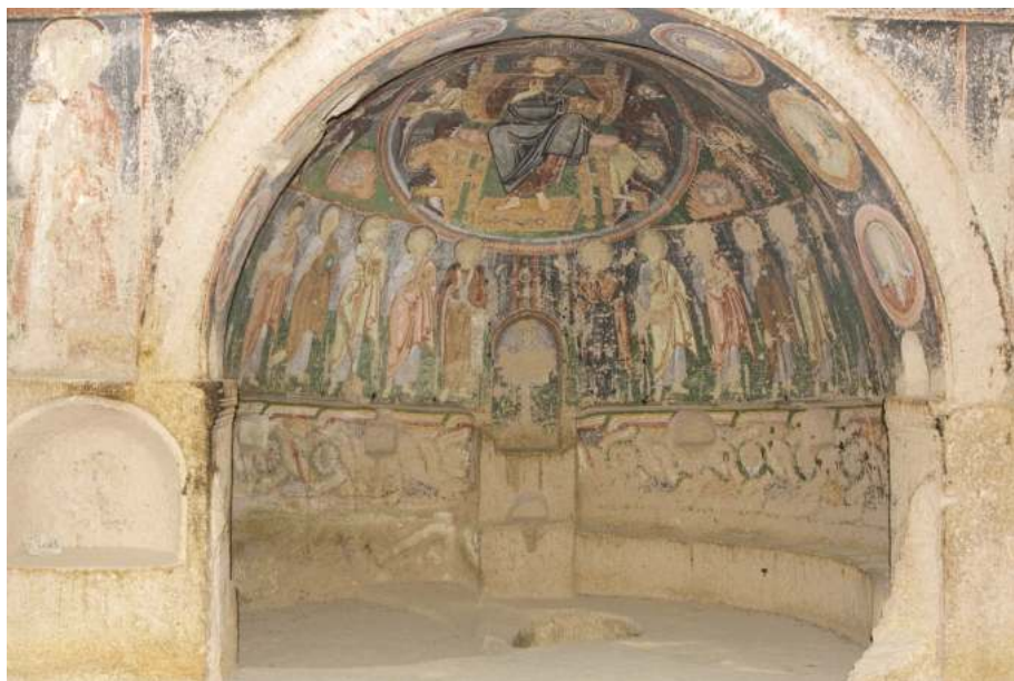
Рис. 5. Кызыл-Чукур. Хачлы-килисе. Нач. X в. В апсиде апостолы, св. Никита и св. Кирик

Одно из таких исключений — церковь св. Иоанна Крестителя (Айвалы-килисе) в долине Гюллю-Дере, датированная 913–920 гг. 32 Она состоит из двух однефных капелл. В южной капелле в алтарной апсиде изображены только святители (не считая нескольких образов других святых в двух нишах).