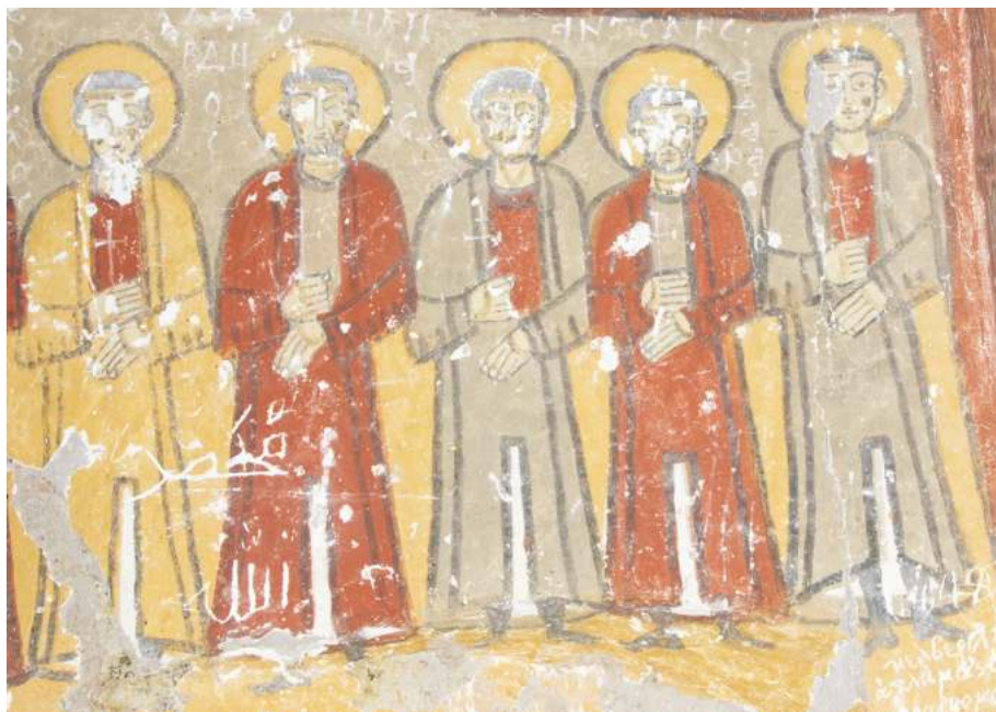
Рис. 2. Йиланлы-килисе в долине Ихлара. Втор. пол. IX – нач. X в. Сорок мучеников Севастийских в нартексе. Деталь

зиция связана с другим изображением Теофании, основанном на текстах ветхозаветных пророчеств и Апокалипсиса, которое также восходит к раннехристианскому периоду и становится наиболее частым сюжетом в конхах апсид каппадокийских храмов эпохи Македонской династии 21 . При этом в нижней зоне апсиды нередко остается ряд с изображениями апостолов, что свидетельствует о связи между двумя сюжетами 22 . Однако уже с начала X в. алтарные компо-