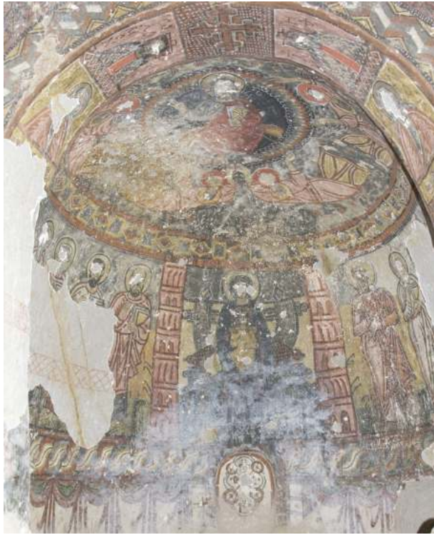
Рис. 3. Йиланлы-килисе в долине Ихлара. Втор. пол. IX – нач. X в. Вознесение в апсиде

зиции каппадокийских храмов претерпевают влияние других схем, очевидно, константинопольского происхождения.