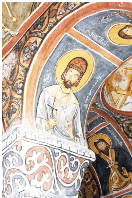
Рис. 15. Каранлык-килисе в Гереме. Третья четверть XI в. Мученики Мардарий, Евстратий и иже с ними

крестово-купольного храма и относимые большинством исследователей к середине XI в. В Каранлык-килисе многочисленные изображения святых написаны в нижних частях сводов, в софитах арок и в нижнем регистре на стенах. Апсиду занимают фигуры святителей. В софитах арок центральной и восточной ячеек представлены пророки и праотцы. В наосе изображены мученики, среди которых выделены небольшие группы и по календарному принципу, и по чинам. Так, Р. 176–177; Jolivet-Lévy C. Les églises... P. 122–125; Thierry N. La Cappadoce... P. 190–195. Fiche 42.