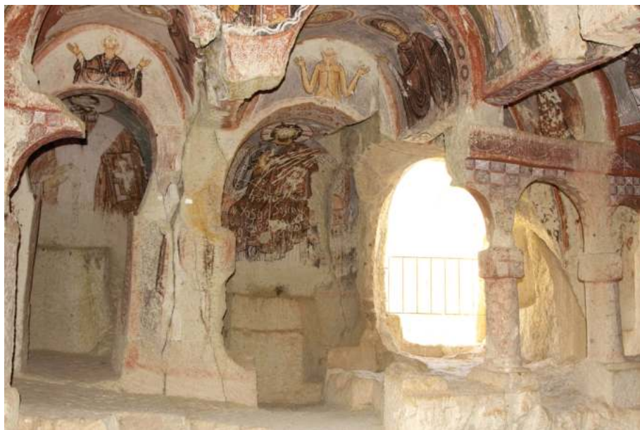
Рис. 13. Мериемана-килисеси в Гереме. Перв. пол. XI в. Общий вид интерьера

которых идентифицируются свв. Константин и Елена и святые воины Георгий и Феодор. На северной стене сохранились изображения популярных в Каппадокии святых Христофора и Евстафия, также бывших воинами.