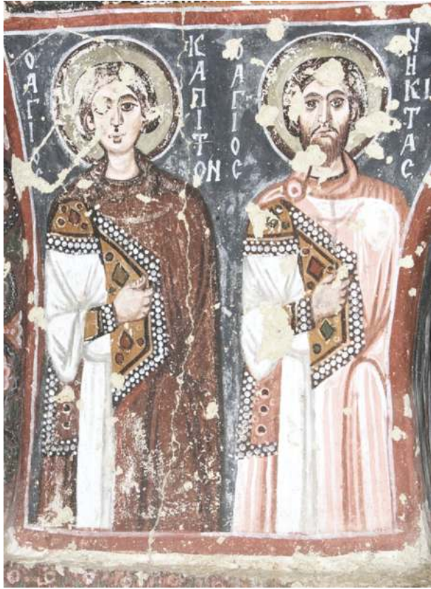
Рис. 10. Кылычлар-килисе. Нач. X в. Мученики Капитон и Никита

медальонах. Еще три фигуры пророков сохранились в софитах арок, обрамляющих западный рукав креста: свв. Давид, Соломон и Иезекииль. Во всех остальных частях храма в софитах арок и нижних частях сводов размещены фигуры мучеников. Внутри этой самой многочисленной категории нет какой-либо дифференциации и тематически подобранных групп (если не считать нескольких пар святых, имеющих общий день памяти). Кроме того, значительное место в программе росписи занимают фигуры апостолов. В центральном куполе помещено Вознесение, с апостолами, стоящими по кругу. В западном рукаве креста