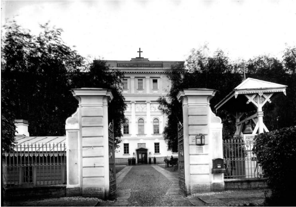
Комплекс Духовной семинарии со стороны Обводного канала. Фото нач. XX в. (ЦГАКФД СПб)

Еще одним проявлением архитектурного такта стало возведение в формах безордерного классицизма боковых квартирных флигелей, фланкирующих главное здание и удачных по своим пропорциям. В правом из них (со стороны канала) разместились правление и квартира ректора, в левом — квартиры учителей. Будучи поставлены перпендикулярно центральному корпусу и набережной, они придали комплексу более репрезентативный вид и сходство с планировкой русских усадеб (ср., напр., знаменитую усадьбу Баташева в Москве). Во дворе по центральной оси главного корпуса, параллельно ему, расположилась больница крайне скромных форм, без выраженной стилистической принадлежности.