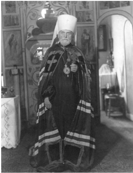
Митрополит Григорий (Чуков) (1870–1955)

Понятно, что ожидать от только что открытой после длительного перерыва школы массовых защит было бы верхом наивности. Однако примечательно, что уже на первом заседании Ученого совета Ленинградской духовной академии в январе 1947 г. первым же пунктом было рассмотрено прошение и утверждена тема магистерской диссертации Н. Д. Успенского. Защита работы «Чин всенощного бдения в Греческой и Русской Церкви» состоялась уже в июне 1949 г. (см. документы № 1, 2, 8).