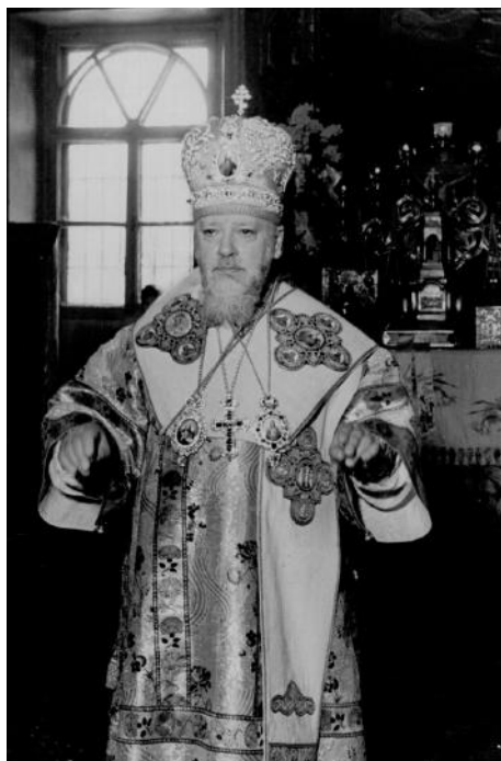
Патриарх Московский и всея Руси Алексий I (1877–1970)

В настоящее время в архиве СПбДА хранятся дела начиная именно с 1946 г. Одним из самых ценных и информативных источников