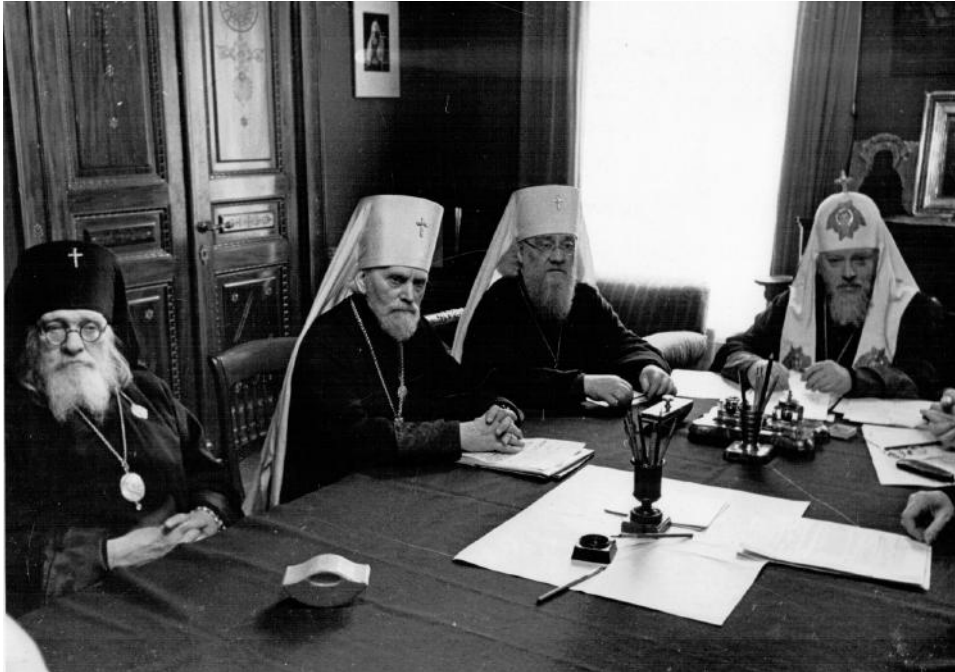
Заседание Священного Синода Русской Православной Церкви

по истории Ленинградских духовных школ в первые годы их деятельности являются Журналы заседаний Совета академии. Данный источник всесторонне отражает внутреннюю жизнь духовных школ в том числе в первые послевоенные годы.