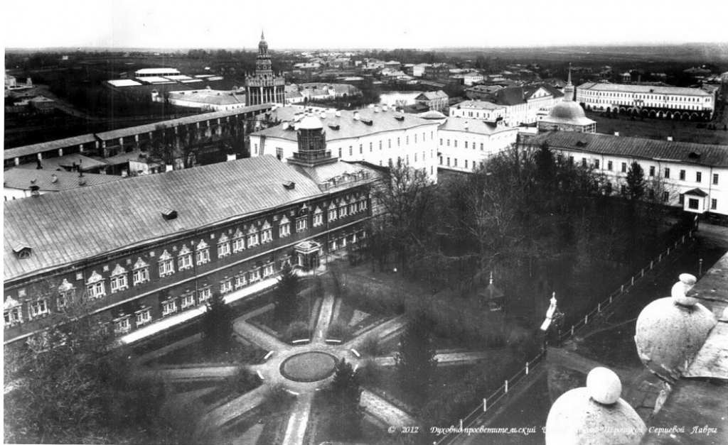
Московская духовная академия в начале XX в.

унификации учебного процесса в системе высшего духовного образования в целом, чтобы существенные расхождения не становились почвой для конфликтных ситуаций. Дневниковая запись от 18 августа 1898 г. отражает содержание диалога по этому поводу с обер-прокурором Св. Синода К. П. Победоносцевым: «В Киевской академии, например, ведутся репетиции, а в Казанской и Петербургской нет. Следовало бы единодушно действовать всем академиям» 17 .