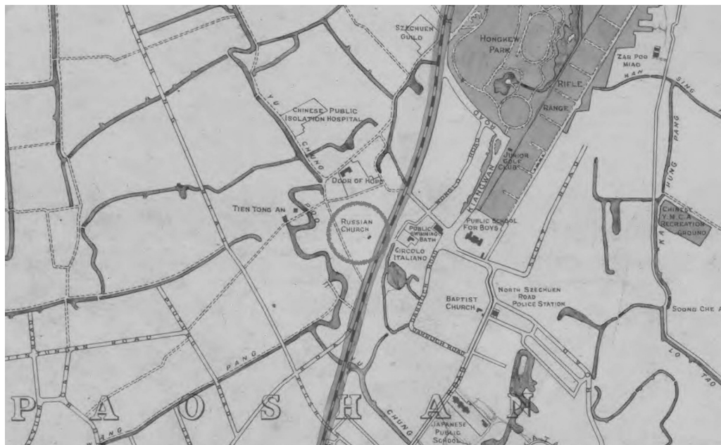
Рис. 4. Фрагмент карты 1923 г. (обведено расположение Богоявленского храма).

Plan of Shanghai / published under authority of the Municipal Council; Commissioner of Public Works. University of Wisconsin-Milwaukee.