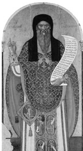
Икона св. Феофила Антиохийского

Св. Феофил Антиохийский. Св. Феофил родился во второй половине II в., точные даты его рождения и смерти не известны, а его творческая деятельность относится к III в. Ему принадлежит сочинение в трех книгах, которое называется «К Автолику». И вот в 15 главе третьей книги впервые в истории встречается слово «Троица», по-гречески Τριάς. До Феофила этого выражения никто не употреблял. Говорили об Отце, Сыне и Духе