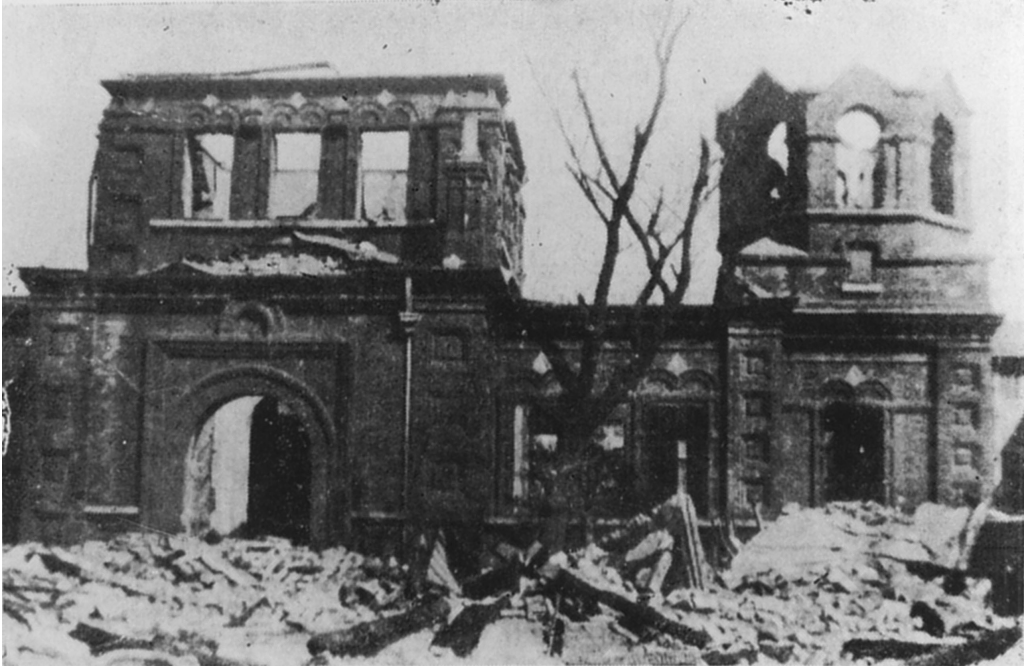
Рис. 6. Разрушенный храм Богоявления Господня в 1932 г. Архив Шанхайской библиотеки. Раздел K264.31.

во Французской концессии, исчислялось сотнями 64 . Несмотря на уменьшавшийся приход, Богоявленский храм действовал еще несколько лет под руководством настоятеля, священника Мефодия Панина.