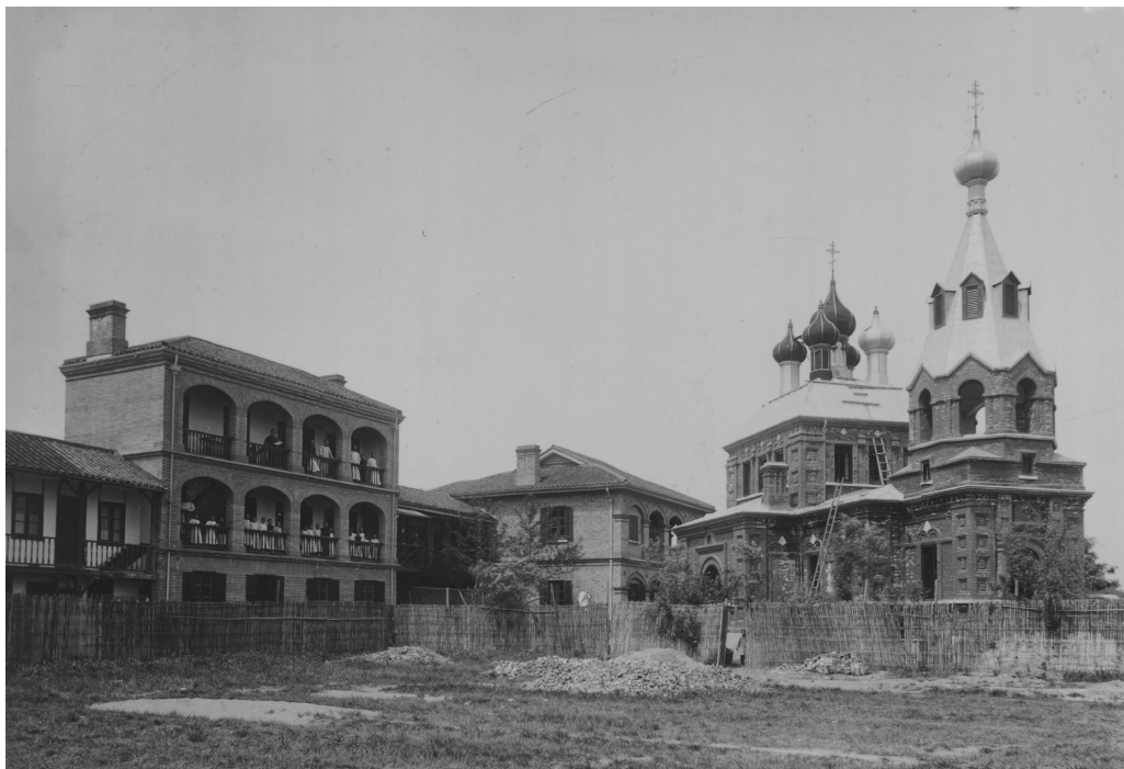
Рис. 1. Подворье в апреле 1904 г. Фото из альбома Пекинской миссии Ф. Р. Остена-Сакена. Предоставлено А. М. Куликовым. РГАДА. Ф. 1385. Оп. 1. Ед. хр. 1943.

средства миссии. К моменту приезда епископа Иннокентия в ноябре 1902 г. шестеро китайских учеников «оказали уже некоторые успехи в изучении русского языка» 5 и были крещены, став «первенцами» шанхайской миссии. На следующий день после крещения, 17 ноября 1902 г., была отслужена первая в Шанхае литургия; впоследствии богослужения стали регулярными. Мальчики и молодежь в возрасте от 11 до 24 лет, родом из окрестных селений, пополняли состав учеников. В 1903 г. число учеников превысило двадцать человек, а к апрелю 1904 г. достигло 27 человек 6 . Основным изучаемым предметом был русский язык. С каждым учеником занимались индивидуально, но не отказывались и от традиционного китайского метода повторения нараспев за учителем: русские фразы писались на доске, читались хором, переводились на китайский. Основы Закона Божьего преподавались на китайском, а ученики постарше проходили Евангелие и Апостол на русском, в сокращенном варианте. Летом ученики отпускались домой на двухнедельные каникулы; после крещения и выпуска молодежь возвращалась в свои семьи. Старшие ученики часто выполняли обязанности учителей, особенно в школе китайской грамоты, которая в начале 1904 г. въехала в старое двухэтажное здание школы. В то же время успехи миссии в христианизации китайского населения были скромны: в 1904 г. православными числились всего 23 человека.