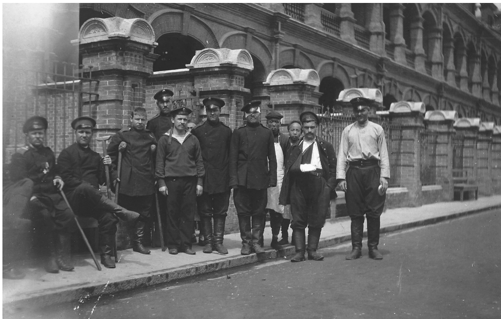
Рис. 2. Раненые ветераны из Порт-Артура в Шанхае, 1904–1905 гг.