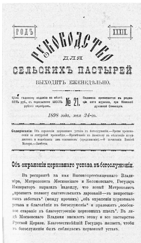
Обложка журнала «Руководство для сельских пастырей»

Данная статья посвящена эволюции в конце 1890-х — 1917 гг. проблемно-тематического облика первого и наиболее известного отечественного периодического издания для приходского 5 духовенства — журнала «Руководство для сельских пастырей» (РДСП), который издавался при Киевской духовной семинарии в 1860–1917 гг. История развития журнала на рубеже веков и в начале 1900-х — 1917 г., в отличие от первых 30–40 лет истории издания, в историографии еще не рассматривалась. Вероятно, поздняя история РДСП была отчасти описана в сочинении протоиерея