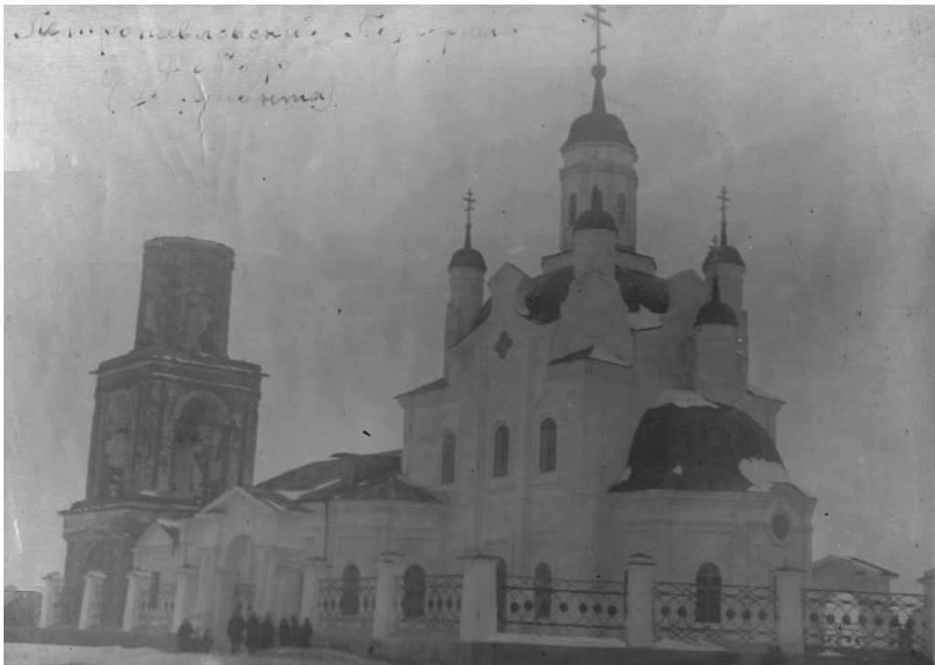
Рис. 2. Собор апостолов Петра и Павла в г. Петропавловск. 1950-е гг.

та носила подчеркнуто просоветский характер: «Духовенство по собственной инициативе проводит церковно-патриотическую деятельность, но вовлекать их специально в политические и хозяйственные кампании не следует, — пишет в очередной инструкции для республиканского Совета Г. Г. Карпов, — необходимо разъяснять, что проведение политических и хозяйственных кампаний — дело советских и партийных организаций» 13 . Таким образом, осуществлялся фактический запрет на самостоятельное участие Церкви в патриотической, социальной и благотворительной деятельности, реализовывалась стратегическая задача вытеснения Церкви из общественной жизни.