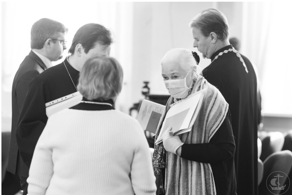
Голосование членов Диссертационного совета

7. Можно констатировать, что в исследуемый период происходило становление и развитие среднего духовного образования в Вологодской епархии, осуществлявшееся при деятельном участии епархиальных архиереев. В рассматриваемый период Вологодскую кафедру занимали восемь архиереев: Павел (Доброхотов) (1866–1869); Палладий (Раев) (1869–1873); Феодосий (Шаповаленко) (1873–1883); Израиль (Никулицкий) (1883–1894); Антоний (Флоренсов) (1894–1895); Алексей (Соболев) (1895–1906); Никон (Рождественский) (1906–1912); Александр (Трапицын) (1912–1924). Каждый из архиереев внес свой вклад в развитие духовного образования в Вологодской епархии. Практически все они имели существенный опыт служения в системе духовного образования, что в значительной мере помогало им в их дальнейшей деятельности;