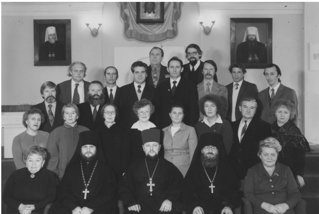
Преподаватели Регентского отделения. 1987 г.

Нужно отметить, что становление будущего труженика на ниве церковно-певческого служения проходило под влиянием великих его современников, с которыми так или иначе Господь сподобил ему соприкоснуться. Так, еще в юные годы М. И. Ващенко получил благословение и пророческое наставление св. прп. Лаврентия Черниговского (схиархимандрита Лаврентия (Проскуры)). Юным студентом он получил от архиепископа Симона (Ивановского) (1888–1966), прошедшего через советские лагеря, много мудрых советов, которым следовал затем на протяжении всей своей жизни. Встречи и слова наставления из уст митрополита Иоанна (Соколова) (1877–1968), митрополита Бориса (Вика) (1906–1965), многих преподавателей и выходцев из дореволюционной плеяды духовенства и церковнослужителей несомненно оставили глубочайший отпечаток в личности Михаила Ивановича Ващенко.