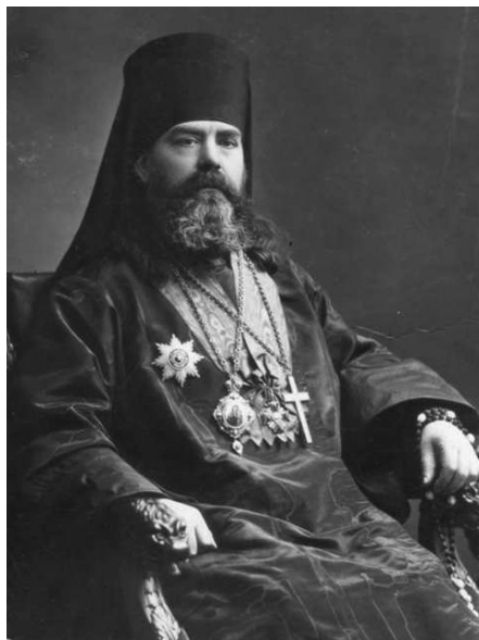
Епископ Арсений (Стадницкий)

Первой церковно-административной должностью будущего митрополита Арсения в сфере духовного образования стало инспекторство в Новгородской духовной семинарии. В ходе личной беседы архиепископ Новгородский и Старорусский Феогност (Лебедев) заранее предупредил нового инспектора об имеющихся нестроениях, отметив неблагоприятное положение дел в семинарии, «расшатавшейся в последнее время по некоторым причинам, а главным образом вследствие раздора бывших начальников» 12 .