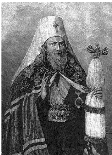
Митрополит Кишиневский и Хотинский Гавриил (Бэнулеску-Бодони)