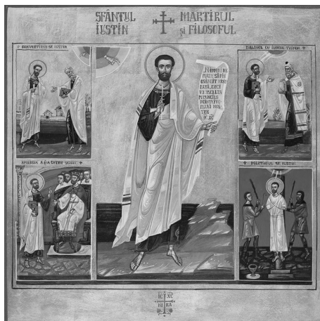
Икона св. Иустина Философа

Приведем еще одну цитату: «Эта сила родилась от Отца Его силой и волей, но не через отсечение, не так чтобы она разделила существо Отца, а подобно тому, что мы видим, когда от одного огня зажигают другие огни, и сколько бы огней от него не зажигали, он нисколько не уменьшается, но остается тем же самым» (Св. Иустин. Разговор с Трифоном, 128). Это место важно потому, что св. Иустин хочет направить мысль рассуждающего о Св. Троице на необходимость избегать вещественных представлений о жизни Божества. Рождение Сына из недр Отца, совершается не так, чтобы существо Отца разделялось, как это бывает при рождении тварных существ, это — духовный процесс, подобие которому можно видеть при зажжении одного огня от другого. Кроме того, для нашего предмета Истории Древней Церкви важно выражение «силой и волей», с которым мы встретимся, когда будем говорить о Никейской эпохе. Далее Иустин говорит: «Нечто подобное мы видим и в нас самих. Когда мы произносим слово — мы рожаем слово, но не через отсечение, не так чтобы находящееся в нас слово уменьшалось вследствие его произнесения». Очевидно, говоря таким образом, св. Иустин мыслит и о слове, которое воплощается в звуках. То и другое можно назвать словом, потому что мысль не может быть без слова, но может быть только беззвучной. С другой стороны, мысль воплощается в слове и лишь благодаря этому, мы можем передавать наши мысли другим людям. И вот, рассуждая об этих двух видах слов «внутреннем» и «внешнем», св. Иустин подчеркивает, что даже