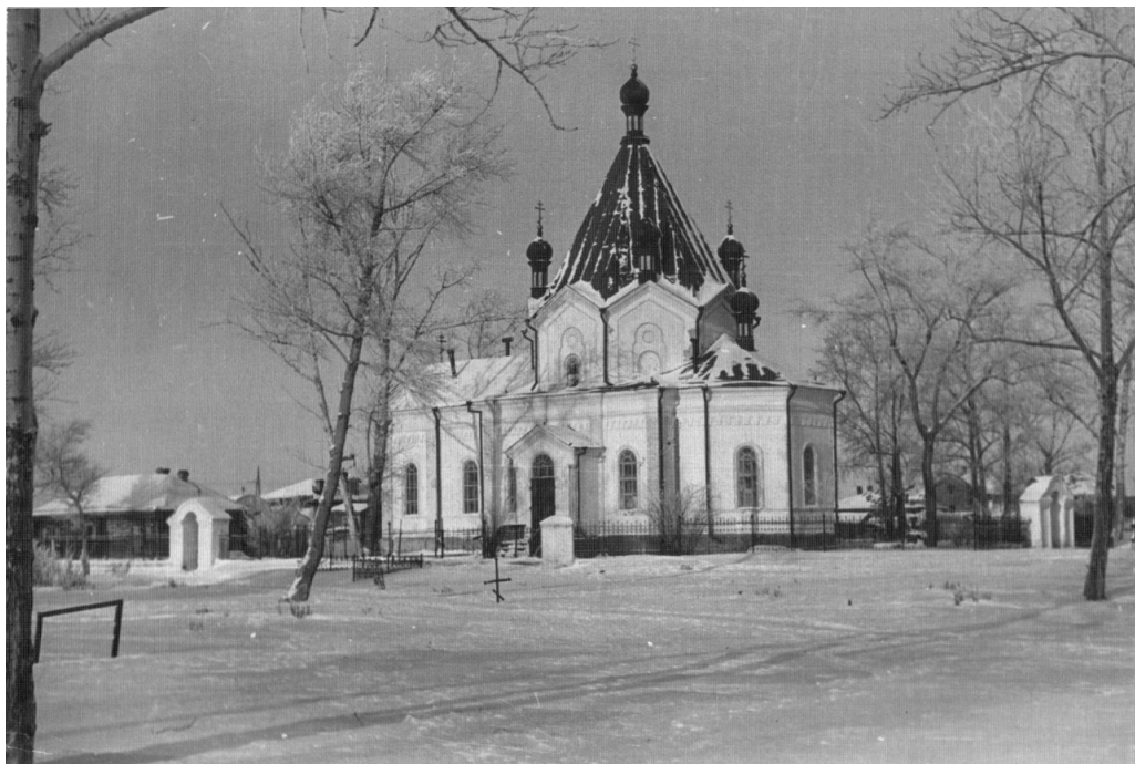
Рис. 1. Храм Всех Святых в г. Петропавловск. 1950-е гг.

ссылным священнослужителям путем организации касс взаимопомощи или иного «субсидирования» 6 .